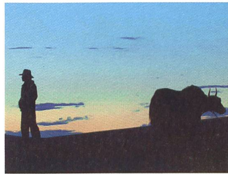
SUMMER PASTURE Regie: Nelson Walker und Lynn True

So haben wir, aus reicher Fülle schöpfend, ein Ensemble von sieben Filmen zusammengestellt. Ähnlich radikal im Ansatz wie BLOOD CALLS YOU ist Jonaas Neuvonens REINDEER SPOTTING, das verblüffend intime Porträt eines drogensüchtigen jungen Mannes aus dem finnischen Rovaniemi. Bass erstaunt waren wir, als wir im Laufe unseres Auswahlwochenendes ein weiteres Mal in Rovaniemi landeten. Dass wir auch den zweiten finnischen Film ins Programm aufnahmen, begründet sich allerdings nicht geographisch, sondern durch die Tatsache, dass Virpi Sautari in AUF WIEDERSEHEN FINNLAND eine weitgehend unbekanntere Geschichte erzählt: die der