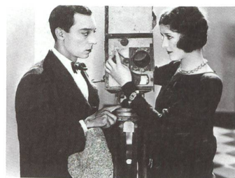
Buster Keaton in THE CAMERAMAN Regie: Buster Keaton