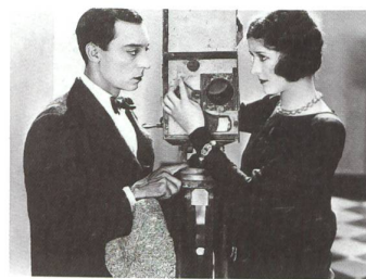
Buster Keaton in THE CAMERAMAN Regie: Buster Keaton