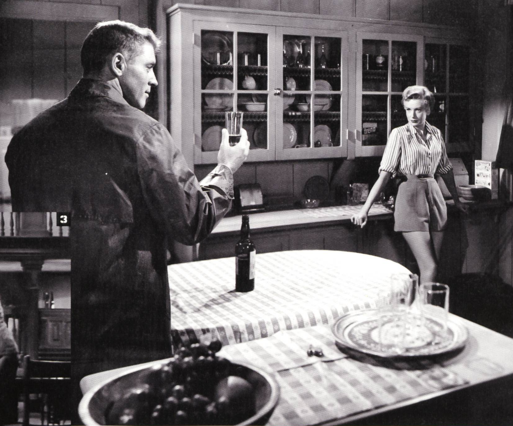
1 THEY WERE EXPENDABLE, Regie: John Ford; 2 FROM HERE TO ETERNITY, Regie: Fred Zinnemann; 3 ATTACK!, Regie: Robert Aldrich; 4 MILDRED PIERCE, Regie: Michael Curtiz; 5 MEN IN WAR, Regie: Anthony Mann; 6 LADY IN THE DARK, Regie: Mitchell Leisen; 7 STORY OF G. I. JOE, Regie: William Wellman; 8 AIR FORCE, Regie: Howard Hawks

diverser äusserer Hindernisse und innerer Zwi- stigkeiten gezeichnet wie auch von den eigenen Verlusten, die jede Kampftruppe in den eigenen Rängen erfahren muss, bevor sie siegreich sein kann. Beliebte Versatzstücke der Filmerzählung bestehen demzufolge aus dem Verstecken vor einer Patrouille oder dem Ausweichen vor feind- lichen Angriffen. Das Gefühl der Angst – und davon lebt die Spannung dieser Gattung – ergibt sich daher, dass die Bedrohung jeweils aus dem Nichts auf die marschierenden Männer einfällt. Die Gegenangriffe auf vereinzelt Feinde dienen ihrerseits dazu, jene Kriegslist zu entfalten, die es den Helden schliesslich erlauben wird, den Feind zu überwinden, auch wenn dies meist nur einen partikularen Sieg und noch nicht das Ende des Krieges bedeutet. Zugleich wird im klassischen Combat Film jeder Militäreinsatz auch als Arbeit dargestellt, in der das ereignislose Marschieren, das Warten, Rauchen, Ausruhen und Essen fast mehr Zeit einnehmen als die eigentlichen Kämpfe mit dem Feind.