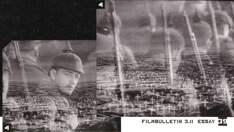
1 FOOTLIGHT PARADE, Choreographie: Buseby Berkeley; 2 THIS IS THE ARMY, Regie: Michael Curtiz; 3 JUDGEMENT AT NUREMBERG, Regie: Stanley Kramer; 4 ALL QUIET ON THE WESTERN FRONT, Regie: Lewis Milestone

reit zeigte, deren Vergehen zu übersehen. Wie die Aufmerksamkeit, die Spike Lee auf den Einsatz schwarzer Soldaten lenkt, korrigiert auch Kramer eine bedenkliche historische Unachtsamkeit. Sein fiktionalisierender Kriegsfilm verurteilt sowohl die Täter wie auch die, welche aus Eigeninteresse deren Schuld aus dem öffentlichen Blick verdrängen wollen. Wie im klassischen Combat Film gilt auch hier das Diktum: Die Opfer des Krieges dürfen nicht vergessen werden.