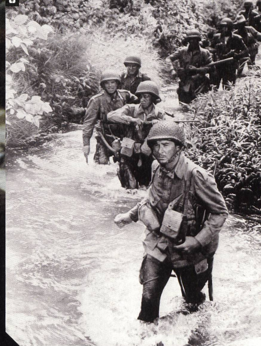
1 MIRACLE AT ST. ANNA, Regie: Spike Lee; 2 FLAGS OF OUR FATHERS, Regie: Clint Eastwood; 3 SANDS OF IWO JIMA, Regie: Allan Dwan; 4 BIRTH OF A NATION, Regie: D. W. Griffith; 5 SAVING PRIVATE RYAN, Regie: Steven Spielberg; 6 OBJECTIVE BURMA, Regie: Raoul Walsh

Kriegskino immer nur als historische Re-Konzep-tualisierung, als imaginäre Übertragung spre-chen. Ist jeder neue Kriegsfilm nie mehr – aber auch nie weniger – als eine Version unter anderen, erhält das Ringen um stets neue Interpretationen indes seine Brisanz dadurch, dass Hollywood massgeblich zur Tradierung des kulturellen Ge-dächtnisses beiträgt. Spike Lees Insistieren dar-auf, wie wichtig filmische Anerkennung sei, er-scheint somit absolut zwingend, weil seit den frü-hen Epen D. W. Griffiths wie BIRTH OF A NATION (1915) und AMERICA (1924) der Kriegsfilm immer auch eine Form des Geschichtsunterrichts war. Er erlaubt einem Massenpublikum, die Historie im doppelten Sinn zu reflektieren: Vergangene militärische Feldzüge erfahren auf der Leinwand eine Widerspiegelung, um damit zugleich über die amerikanische Kultur zu reflektieren, nach-zudenken. Zwangsläufig bietet dieses kinemato-graphische Re-Enactment nur eine Annäherung an traumatische Geschichtsereignisse, zugleich wird die historische Erfahrung über den Umweg der ästhetischen Refigurierung aber auch den Be-langen der Gegenwart angeglichen.