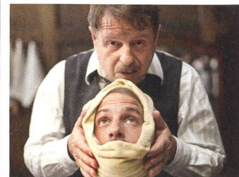
EINE WEN IIG, DR DÄLLEBACH KARI Regie: Xavier Koller