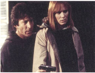
Dustin Hoffman und Marthe Keller in MARATHON MAN Regie: John Schlesinger