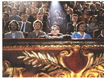
THE LONG DAY CLOSES Regie: Terence Davies