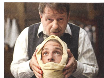
EINE WEN IIG, DR DÄLLEBACH KARI Regie: Xavier Koller