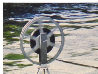
Roman Signer Filmrolle, 1985 Super-8-Filmstill

Für einmal hat das Aargauer Kunsthaus fast alle der flexiblen Ausstellungswände aus dem Erdgeschoss des Erweiterungsbaus entfernt, um einen grossflächigen Ausstellungssaal von über 600 Quadratmetern zu erhalten. In diesem sind 36 Super-8-Filme von Roman Signer nebeneinander gereiht und erinnern damit an eine museale Bildhängung. In diesem Fall sind es nicht 36 unbewegte Bilder, es sind 36 Filme, alle tonlos, die Roman Signer aus rund zweihundert Filmen ausgewählt hat. Sie sind ohne Ton, weil sie als Dokumentationen seiner Installationen und Aktionen zu verstehen sind und weil dadurch, wie Signer an der Medienkonferenz erklärte, die Konzentration auf das eigentliche Geschehen nicht absorbiert wird.