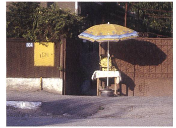
Roman Signer Strassenbilder, Karpaten, Ukraine, Rumänien, 2005 1 von 47 Farbphotografien, 31 x 49 cm