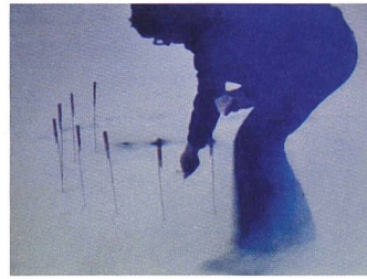
Roman Signer Kreis, 1981 Super-8-Filmstill