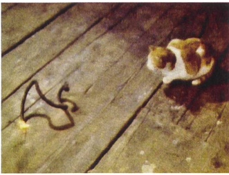
Roman Signer Katze, 1979 Super-8-Filmstill