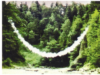
Roman Signer Bogen, 1978 Super-8-Filmstill