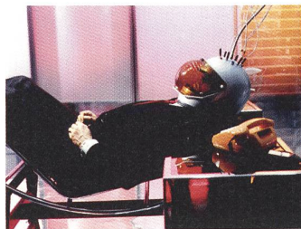
WELT AM DRAHT Regie: Rainer Werner Fassbinder