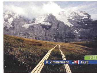
LAUBERHORNRENNEN IM SOMMER Regie: Daniel Zimmermann