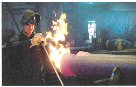
TOUT UN HIVER SANS FEU von Greg Zglinski (2005)

Fest verschliessbare Türen für alle Eisenbahnwagen müssten Vorrang haben gegenüber den digitalen Techniken der Bespitzelung und des Zurschaustellens. Doch scheint zwischen den zwei Extremen nichts Drittes gegeben: ähnlich wie zwischen dem vorschnellen Alfred und dem bedächtigen Jurek, die keinen Ausgleich finden. Fragt sich bloss, ob die Firma der Beiden, eines von vielen Internet-Fernsehprogrammen, auf die düsteren Geschehnisse in der Besitzerfamilie warten musste, um ins Prekäre zu verrutschen und unters Rad des sogenannten Wachstums zu geraten. Ein Bruder weniger, endlich. Die Geier warten schon. Ob es nach Verwesung riecht oder nach Frischfleisch, der freie Markt leckt sich die Finger. Bieter, Makler klopfen an, wegen steigender oder sinkender Werte und Preise. Polen scheint in die mobile Zukunft integriert: ein Spielball mehr.