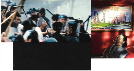
Bilder: S. 33, 34 und 36: UFO IN HER EYES