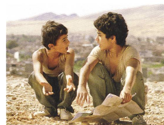
BEKAS Regie: Karzan Kadel