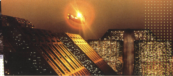
1 William Dafoe in to live and die in L.A. , von William Friedkin (1983); 2 Harrison Ford in blade runner von Ridley Scott (1982)