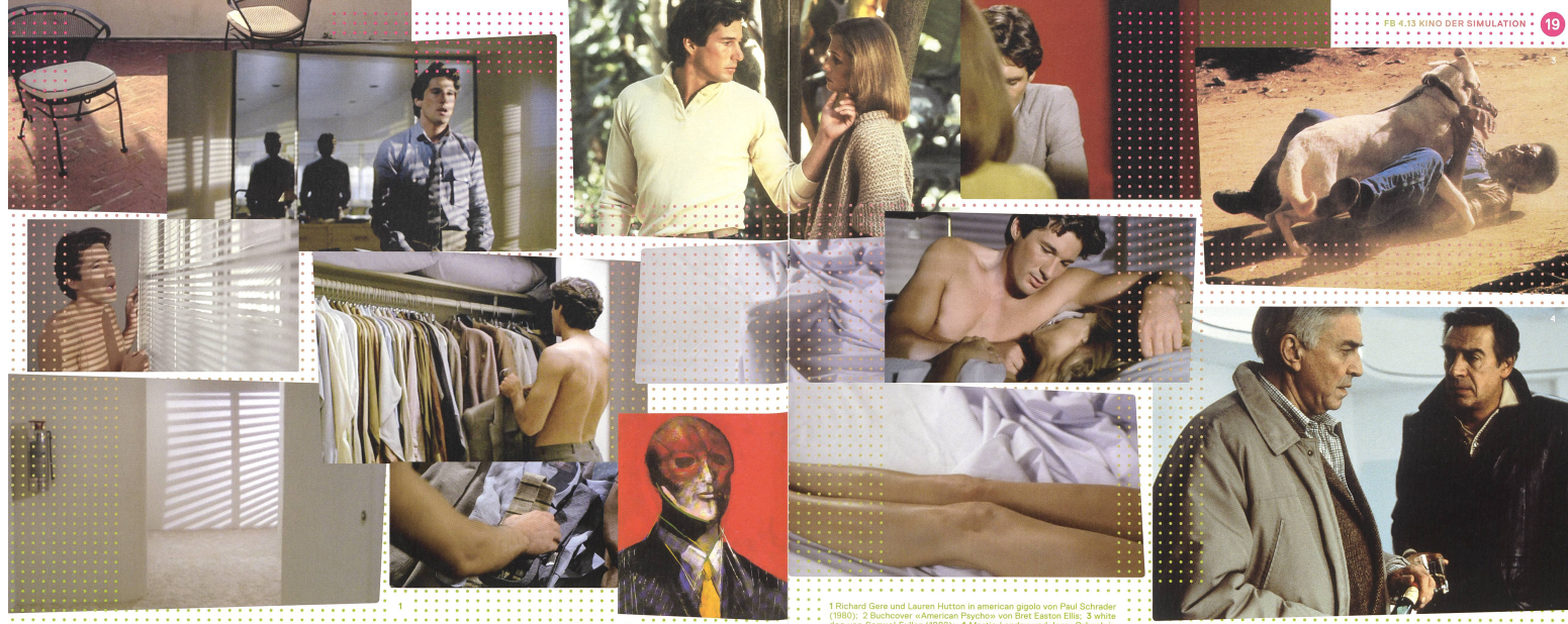
1 Richard Gere und Lauren Hutton in american gigolo von Paul Schrader (1980). 2 Buchcover «American Psycho» von Bret Easton Ellis. 3 white dog von Samuel Fuller (1982). 4 Martin Landau und Jerry Orbach in crimes and misdemeanors von Woody Allen (1989)

der sich in den Hals einschneidet. Der Killer in BODY DOUBLE muss noch weiter gehen: Er mordet mit dem Betonbohrer, dringt durch den Körper seines Opfers und noch durch den Fussboden hindurch, auf dem es liegt – je hermetischer die Oberfläche, umso extremer muss die Gewalt sein, um sie zu durchbrechen.