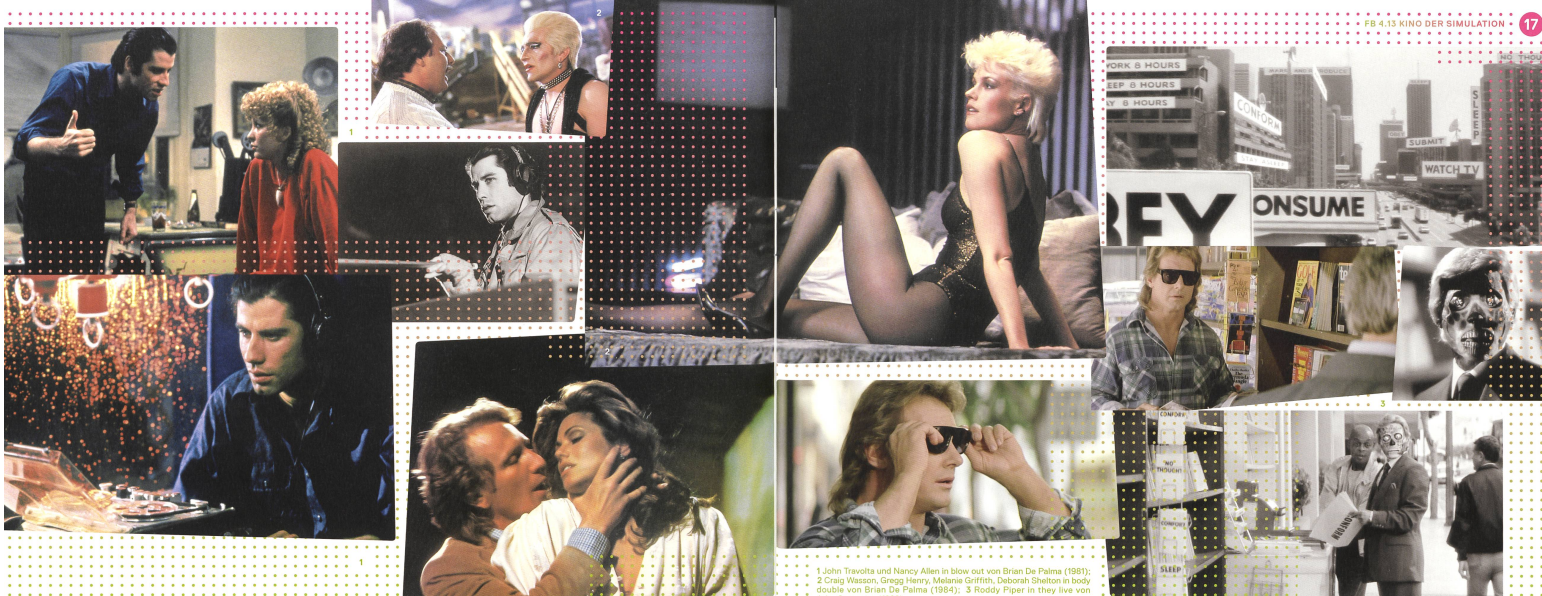
1 John Travolta und Nancy Allen in blow out von Brian De Palma (1981); 2 Craig Wasson, Gregg Henry, Melanie Griffith, Deborah Shelton in body double von Brian De Palma (1984); 3 Roddy Piper in they live von John Carpenter (1988).

artifiziellen Oberfläche des Films nichts verbirgt. Die Figuren bleiben blosse Puppen, so wie der aufblasbare Autopilot im Cockpit, statt dass sie Witze reissen, ist es der Film selbst, der an ihrer Stelle Faxen macht.