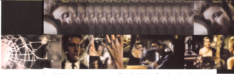
LOCOMOTIVE (2008) NÉCROLOGUE (1999) KRISTALL (2006)