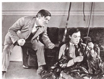
SHERLOCK JR. Regie: Buster Keaton