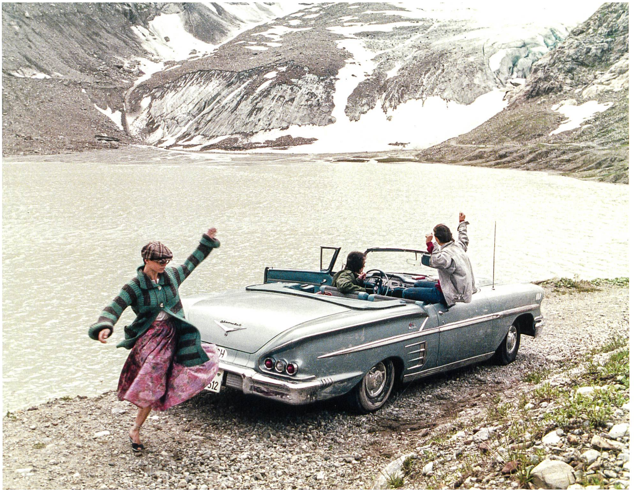
Steine des Anstosses Über die Beziehung des Schweizer Films zu seinen Bergen S. 6 Die Erweiterung der Pupillen beim Eintritt ins Hochgebirge Eine Art Making-of S. 62