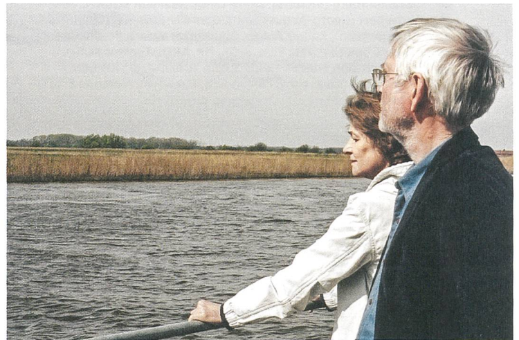
45 Years Aus dem Takt geraten