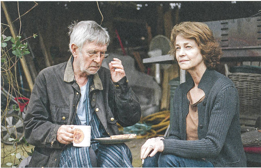
45 Years Tom Courtenay und Charlotte Rampling