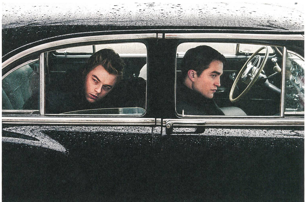
Life Dane DeHaan und Robert Pattinson