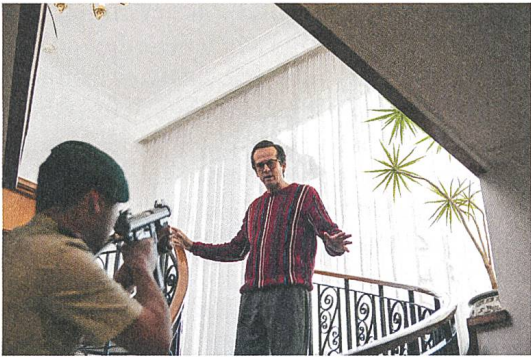
The Program Bill Stapleton