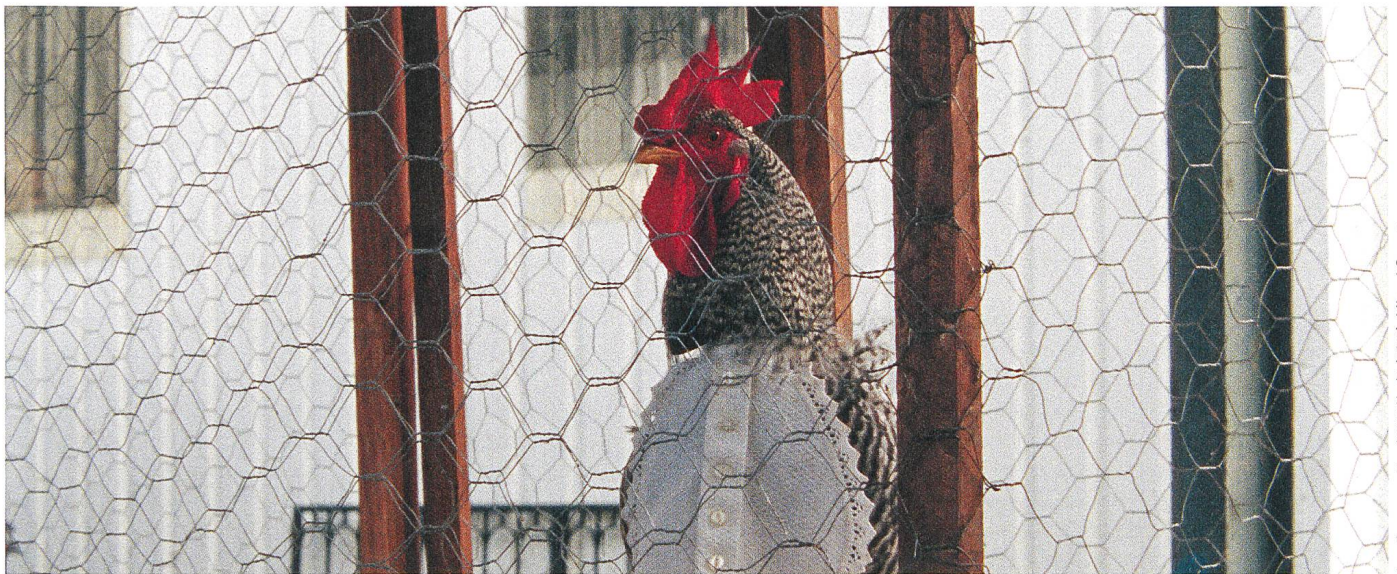
As mil e uma noites / 1001 Nacht (2015), Miguel Gomes