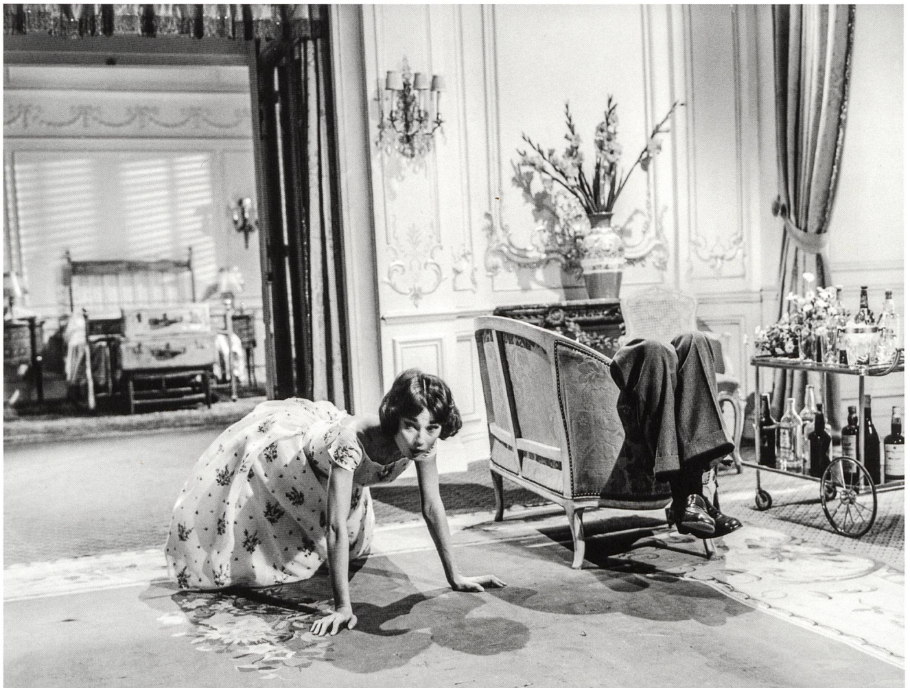
Hotel im Kino Eine Welt für sich S. 6