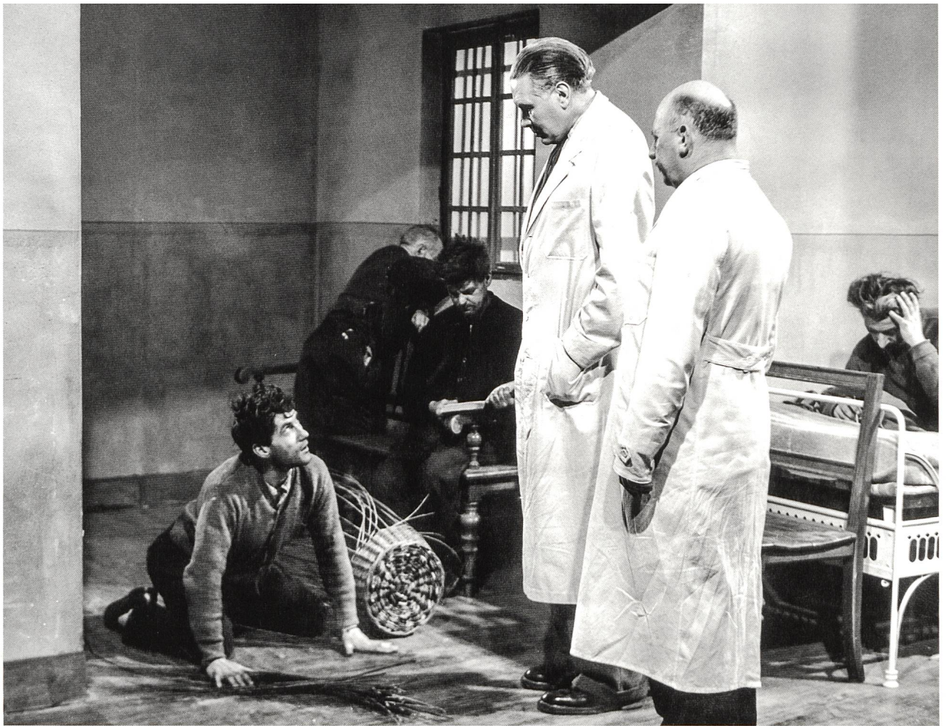
Bilder geben Übertragungen zwischen Film und Psychiatrie S. 46