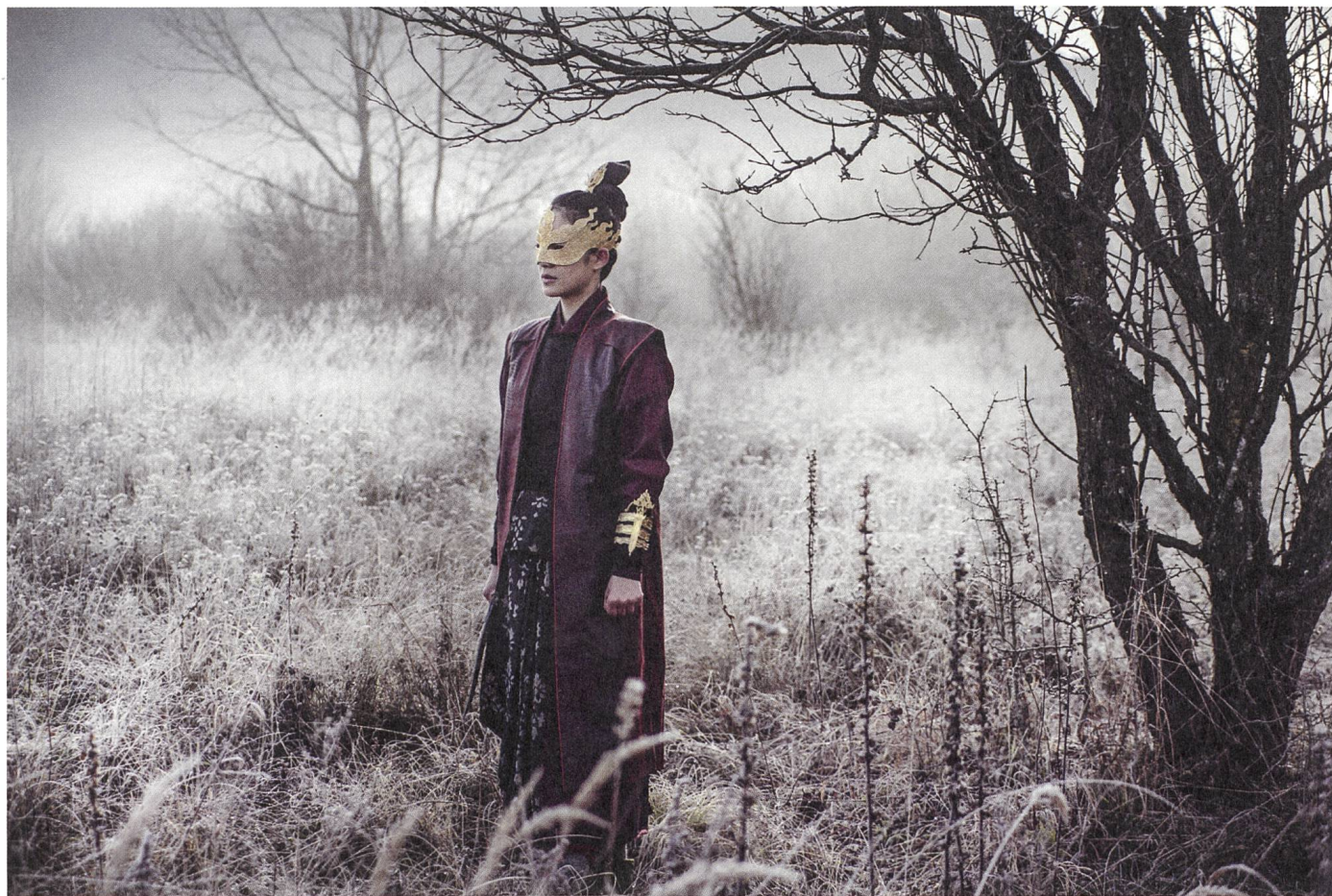
Shu Qi in The Assassin (2015), Regie: Hou Hsiao-hsien