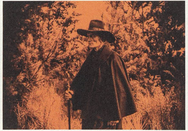
Der müde Tod (1921) Regie: Fritz Lang

Leuchtreklamen, die in der digital restaurierten Fassung (im Vorführformat 4K DCP) noch bunter zu blinken scheinen. Der Titel bezieht sich auf einen Comic, der im alten Ägypten spielt und so eine weitere Erzählebene, quasi als Flucht vor der Realität, einzieht.