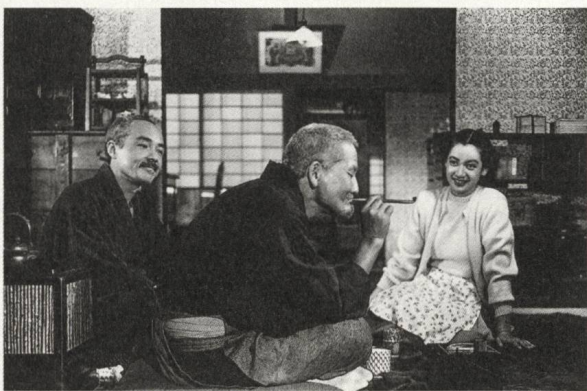
Bakushu (1951) Regie: Yasujiro Ozu

Zu den grossen Stärken der Berlinale zählt jedes Jahr auch der Blick zurück in die Filmgeschichte mit Retrospektiven, Tributes, Hommagen, Veranstaltungen und Ausstellungen. Und den Berlinale Classics , die seit 2013 die Retrospektive auch unabhängig vom jeweiligen Thema erweitert und einen Blick erlaubt auf den aktuellen Stand digital restaurierter Filmklassiker, von der Stummfilmzeit bis zu den achtziger Jahren.