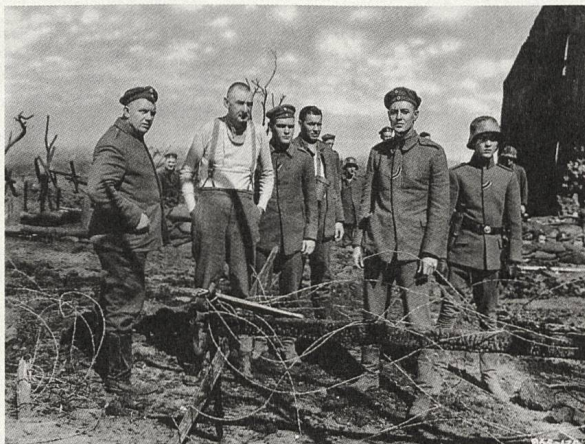
The Road Back (1937) Regie: James Whale

Einer der unbekanntesten, sehr selten gezeigten Filme von Hou Hsiao-hsien ist Daughter of the Nile (Ni luo he nu er) aus dem Jahr 1987. Im Mittelpunkt des Films steht eine junge Frau, die als Bedienung bei Kentucky Fried Chicken arbeitet, die Abendschule besucht und sich nebenbei um ihre kleine Schwester kümmert. Der Bruder hingegen hält sich als Ganove über Wasser und versucht, mit Kumpeln ein Restaurant zu betreiben. So etwas wie ein Krimiplot scheint sich zu entwickeln, aus der Ferne winken John Woo oder Wong Kar-wai. Doch hier geht es mehr um das grimmig ästhetisierte Porträt einer verlorenen Jugend in einem modernen Taipeh voller