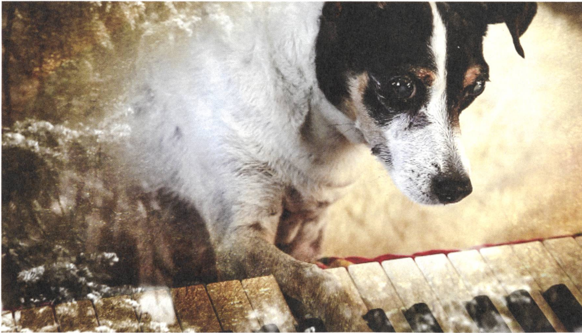
Heart of a Dog «Es gibt ja Millionen Formen von Liebe»