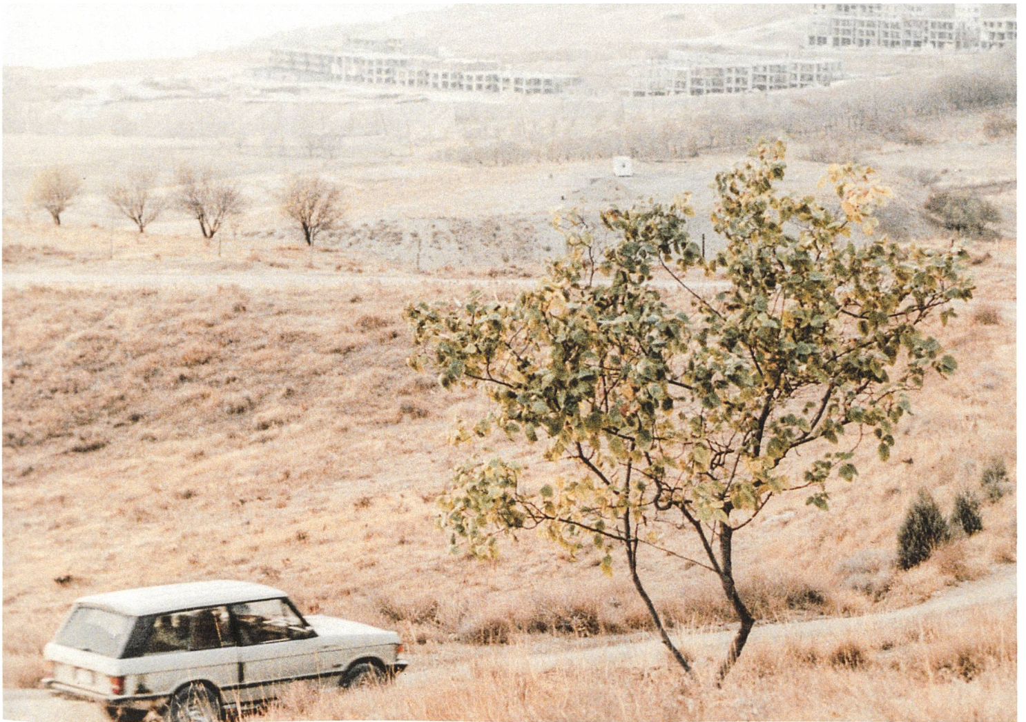
Le goût de la cerise / Ta'm e guilass (1997) Regie: Abbas Kiarostami

My car's my best friend. My office. My home. My location. I have a very intimate sense when I am in a car with someone next to me.