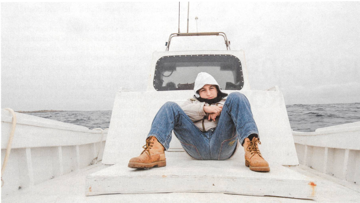
Fuocoammare Der Junge und das Meer