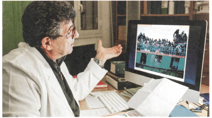
Fuocoammare «Es ist unsere Pflicht zu helfen.»