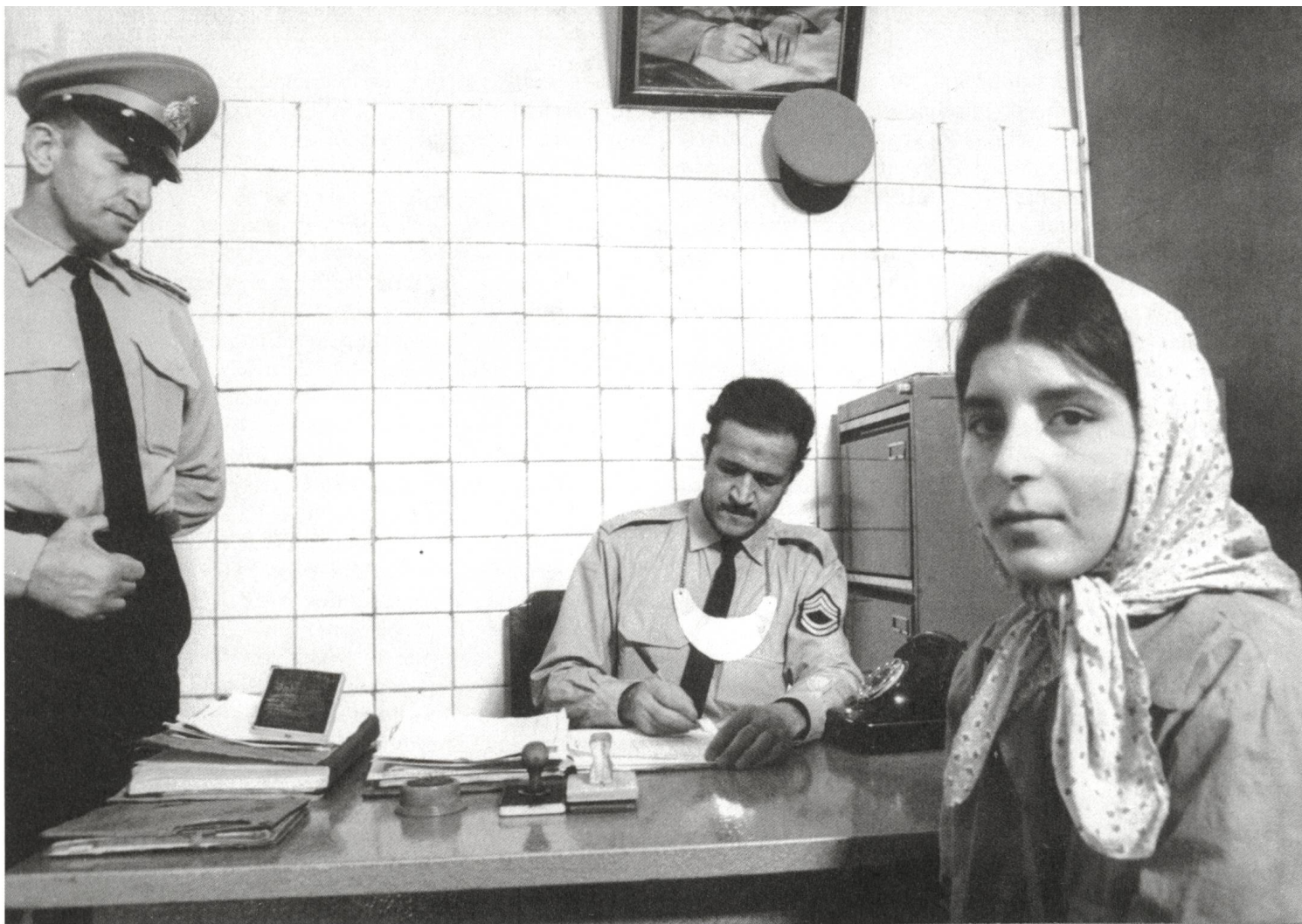
Nedamatgah / Women's Prison (1965) Regie: Kamran Shirdel

Alleinstellungsmerkmal des postrevolutionären Kinos festhält: «Our society needed a cinema with a different point of view.» Obwohl lange Zeit international eher unbekannt, kann Bani-Etemad als eine der wichtigsten Exponentinnen eines «Neuen iranischen Kinos» betrachtet werden, das nicht zuletzt auch ein Nachkriegskino war: ein Kino nach dem Iran-Irak-Krieg. Erst mit Nargess (1992), ihrem Teheran-Noir über eine Dreiecksgeschichte im Diebesmilieu, wurde Bani-Etemad einem internationalen Festivalpublikum bekannt.