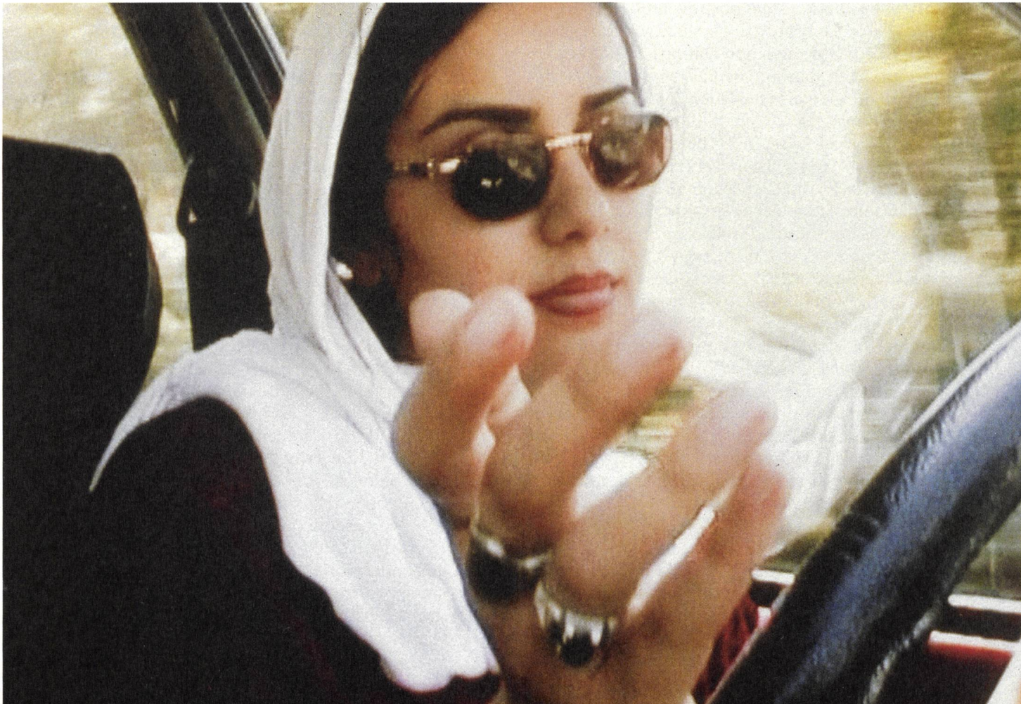
Dah / Ten (2002) Regie: Abbas Kiarostami

Während die Filmemacher der ersten Neuen Welle (vor 1979) Kritik an den Autoritäten der Modernisierung und Industrialisierung übten, lagen die sozialkritischen Filmemacher nach der islamischen Kulturrevolution von 1979 im Clinch mit religiösen Autoritäten, die alles taten, um die Ideale der Revolution ungeachtet der sozialen Missstände als verwirklicht zu behaupten. Die vielleicht radikalste Vertreterin einer sozialrealistischen Welle nach 1979 ist Rakhshan Bani-Etemad , die bei der internationalen Festivalpolitik zu lange zu wenig Beachtung fand, obwohl ihr mittlerweile fünfzehn Filme umfassendes Werk – darunter Under the Skin of the City (2001) oder Tales (2014) – eine komplexe Sozialgeschichte Teherans von den Achtzigern bis in die Gegenwart darstellt, eine Reise unter die Haut der Stadt, zu Tabuthemen der Gesellschaft wie Kriminalität, Prostitution und häusliche Gewalt. Shirdels und Golestans Grossstadtsymphonien finden eine Fortsetzung in den eigensinnigen Filmen Bani-Etemads, die sich dezidiert als Künstlerin mit sozialer Verantwortung sieht und in unnachahmlich mutiger Weise ihre Interessen an tabuisierten Themen gegen die Zensur durchsetzt, hierbei aber auch an einem bestimmten