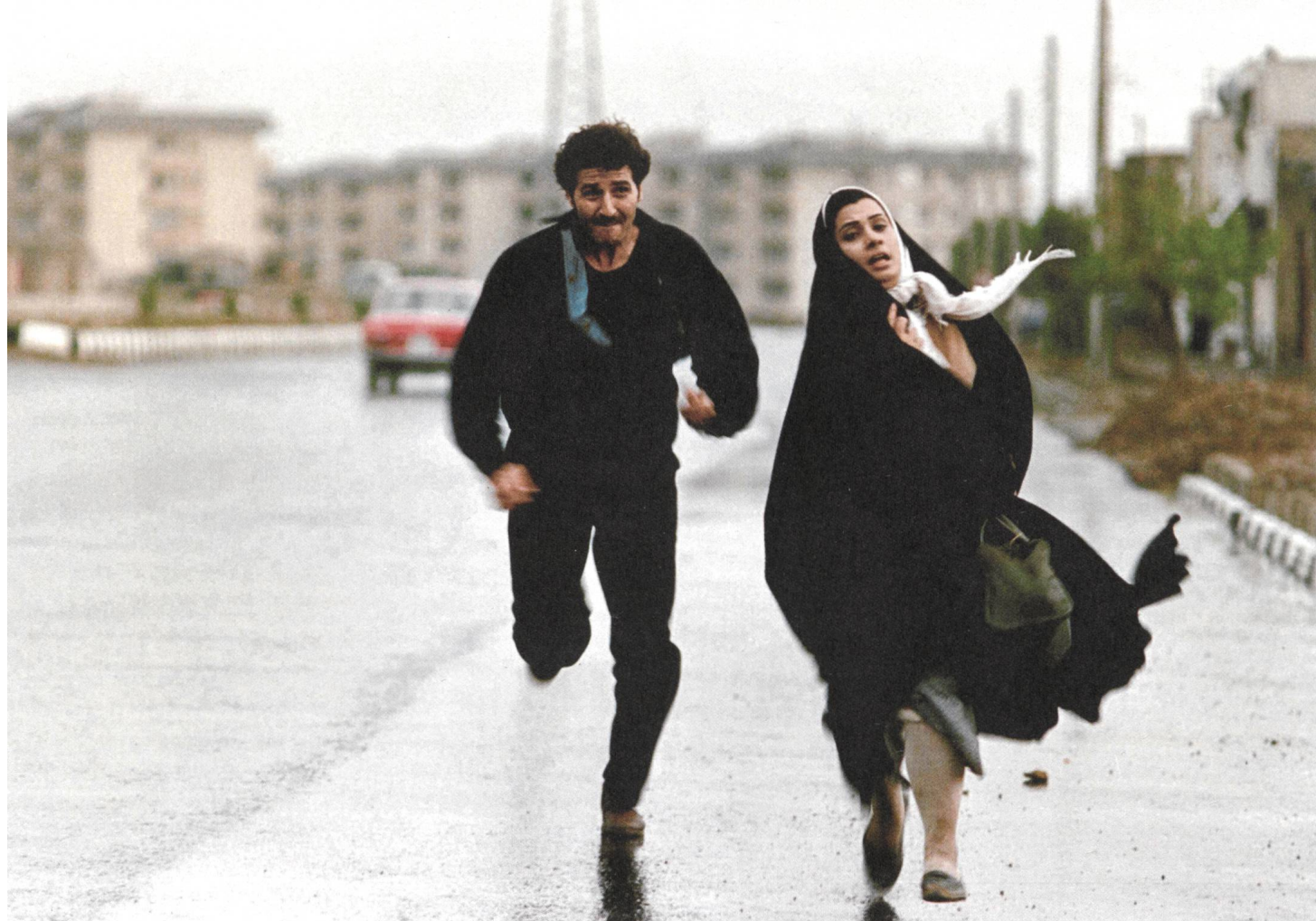
Nargess (1992) Regie: Rakhshan Bani-Etemad

Purifizierung der vorrevolutionären Kultur des Spektakels, durch Importverbot – auch in Hinblick auf Filme der Vergangenheit – und durch Zensur im Dienst der staatlichen Implementierung islamischer Werte. Das Theater des Schahs wurde mit dem theater of chador (Kate Millet) überschrieben, während des achtjährigen Iran-Irak-Kriegs (1980–88) auch mit dem Theater des Märtyrertums. Die versuchte Uniformierung und Reformulierung des Kinos nach 1979 hatte allerdings keine homogene Schule des Sehens zur Folge, sondern ein komplexes Laboratorium, in dem die Formen des Filmbilds zwischen haram (Verbotenem) und halal (Erlaubtem), Ikonoklasmus und Ikonophilie, ständig neu verhandelt werden mussten.