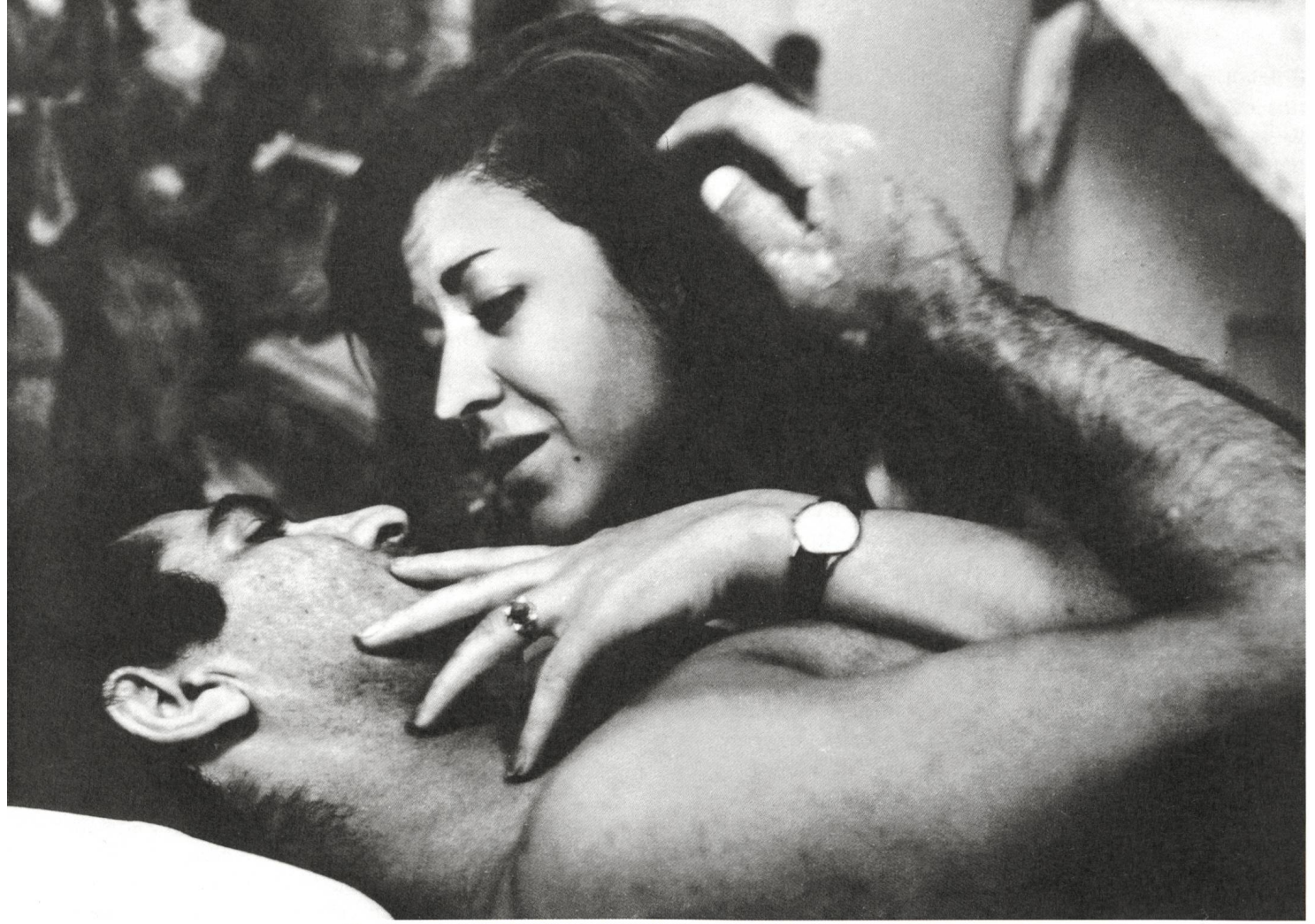
Khesht va Ayeneh / The Brick and the Mirror (1965) Regie: Ebrahim Golestan

sind beide Städte, eine eigene Noir-Tradition haben sie auch hervorgebracht. Ihre Filme sowieso. Hossein Amini ist 1966 im Iran geboren und hat das Drehbuch zu Drive (2011) geschrieben. Er lebt schon lange nicht mehr im Iran. Der Ausdrucksminimalismus und die Berührungsenthaltsamkeit in Drive erinnern trotzdem stark an iranische Filme. Vielleicht hat Ana Lily Amirpour mit A Girl Walks Home Alone at Night (2014) jenen krypto-iranischen Sprit explizit gemacht, den Drive implizit antreibt.