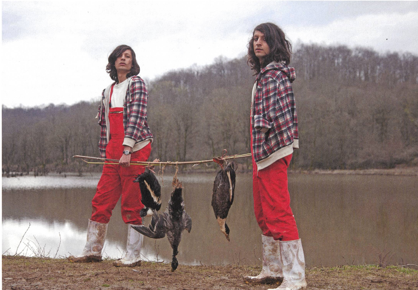
Mahi va Gorbeh / Fish & Cat (2013) Regie: Shahram Mokri

Chomeini hat sich für seine Rede nicht ohne Grund den armen Süden der Stadt ausgesucht und Kiarostami vielleicht nicht ohne Grund ein Grab im reichen Norden der Stadt erworben. Wenn es in Teheran bergauf geht, dann geht es in Richtung Norden, wo nicht nur die Luft wohlhabender ist. Das kann man aus dem Beginn von Kiarostamis Close-Up (1991) lernen. Dort geht es zu Beginn auch hinauf, mit dem Auto durch baumflankierte, gitterförmig angelegte Strassen, gesäumt von Villen hinter hohen Zäunen und Mauern, vor denen Mopeds mit Windschildern stehen. Oft wird der Norden Teherans mit Beverly Hills verglichen. Über Los Angeles lässt sich das Umgekehrte sagen, dort entstand nach 1979 Tehrangeles («Little Persia»), eine der grössten Gemeinden iranischer Emigranten weltweit. «Zwischen Teheran und Los Angeles – Stadt der grössten iranischen Exilgemeinde – existiert eine starke virtuelle Verbindung» (Jochen Becker). Car-driven towns