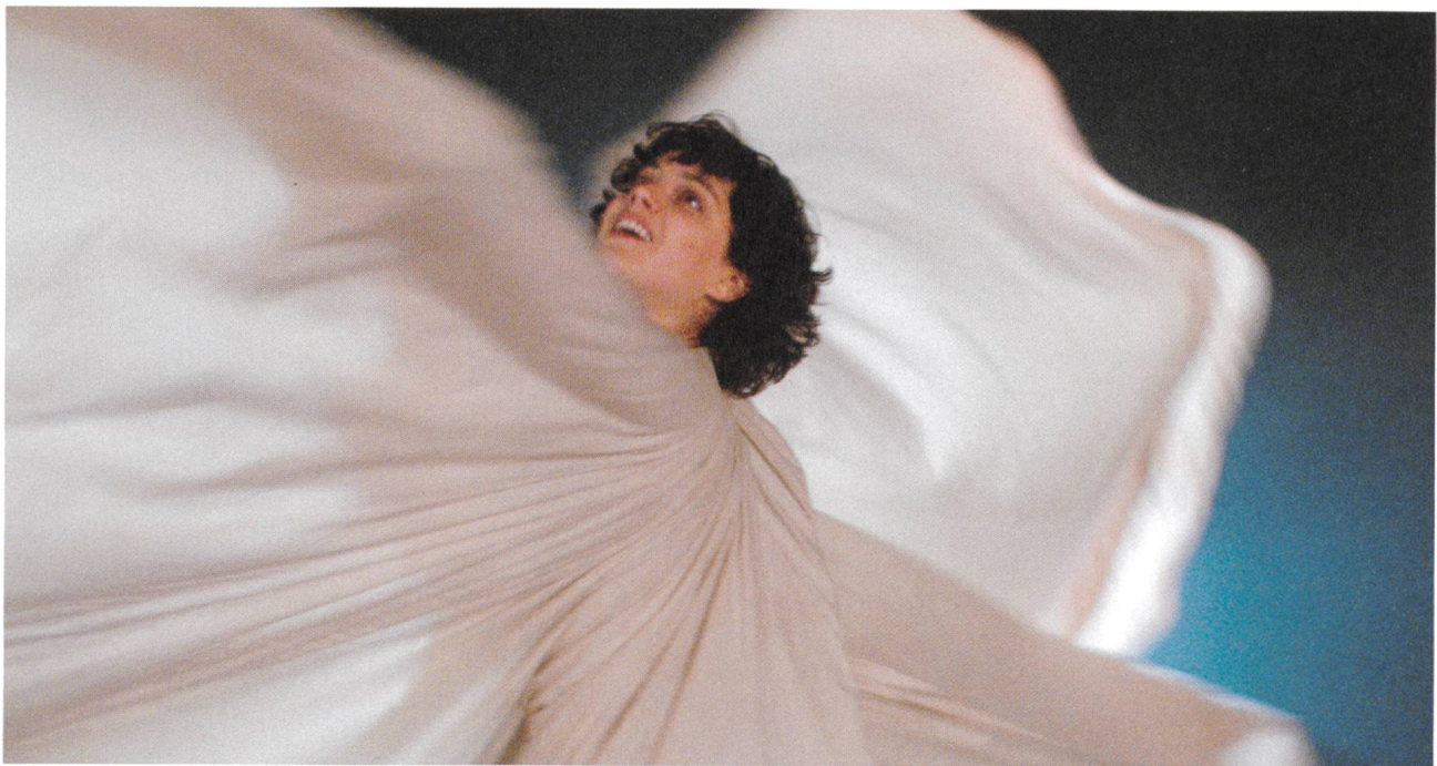
La danseuse Regie: Stéphanie Di Giusto