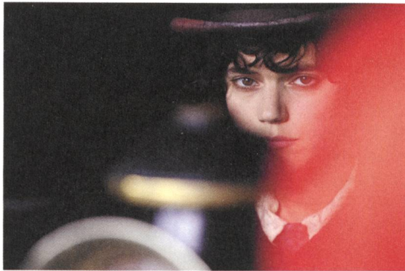
La danseuse Soko als Loïe Fuller