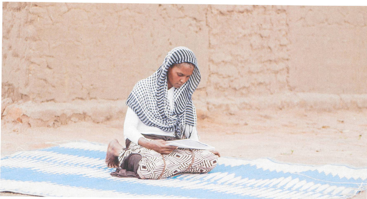
Cahier africain Zentralafrika: «Immer ist hier Krieg»