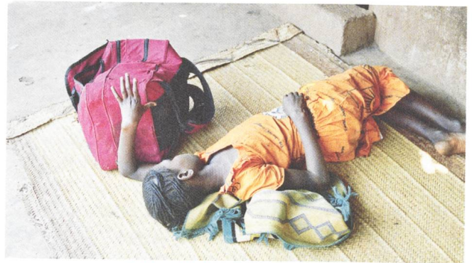
Cahier africain Gegen die Gewalt