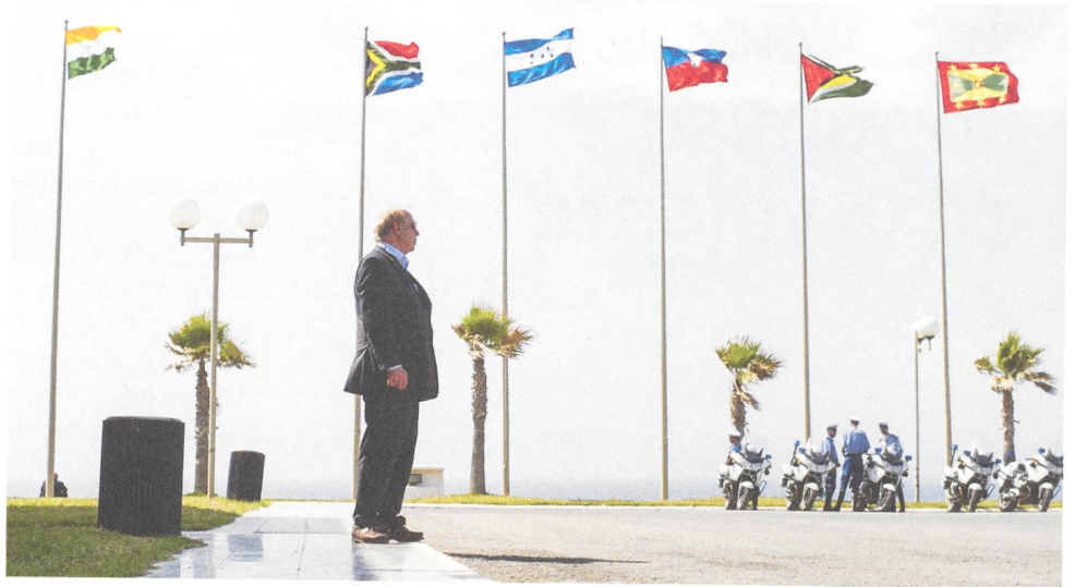
Jean Ziegler Unermüdlicher Kämpfer