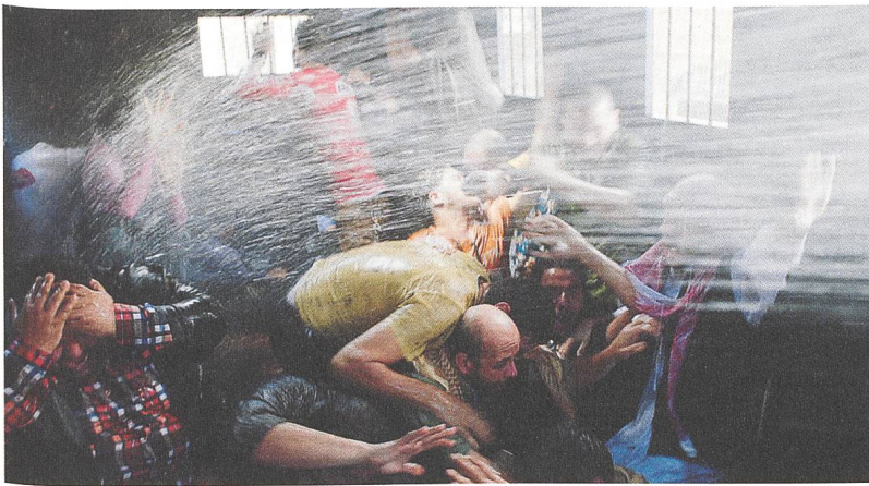
Clash Huis-clos im Polizeiwagen