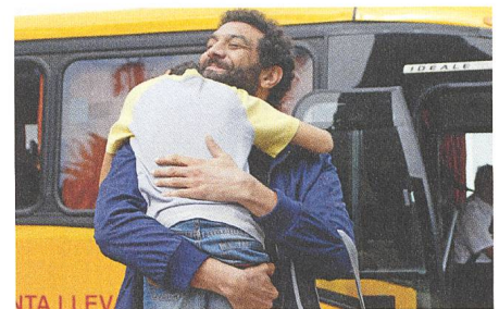
Une vie ailleurs Regie: Olivier Peyon