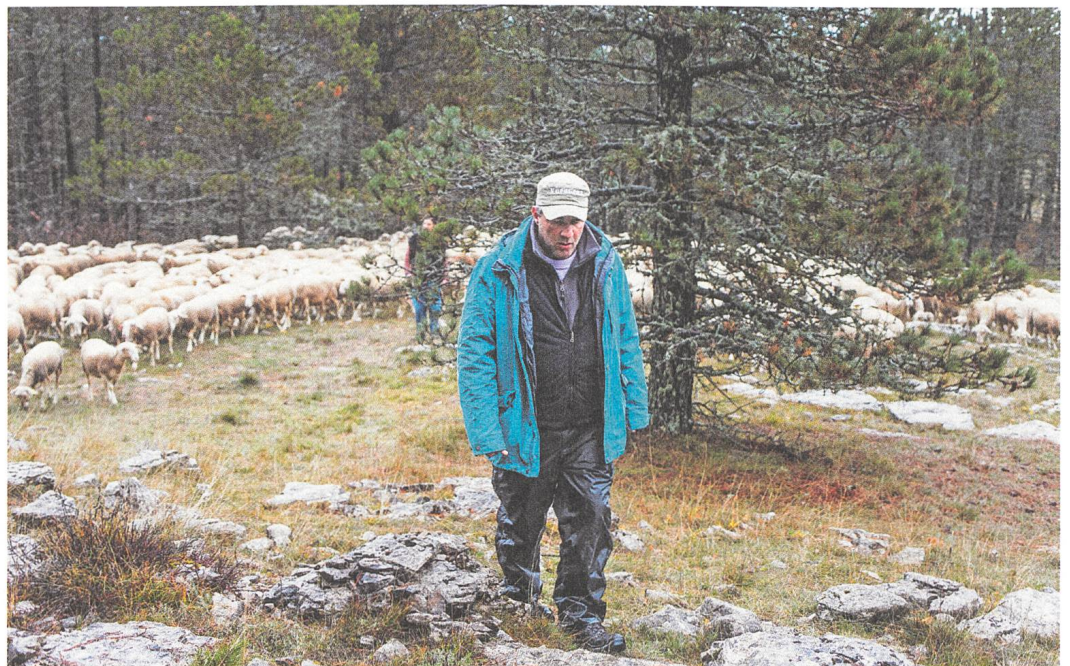
Rester vertical Regie: Alain Guiraudie