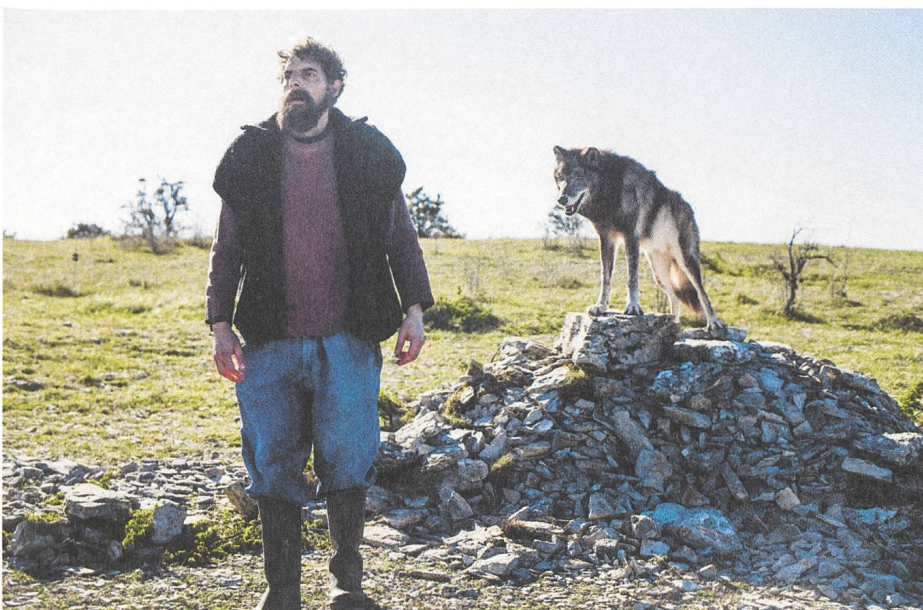
Rester vertical Regie: Alain Guiraudie