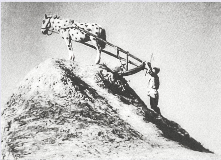
Das Glück (1935) Regie: Alexander Medwedkin

Wer sich der Rolle des Tiers im Kino zuwendet, wird bald feststellen, dass das Kino von Tieren nur so wimmelt. So wird die Frage nach den Filmen mit Tieren bald abgelöst von einer anderen: Gab es jemals ein Kino ohne Tiere? War das Kino niemals nur ein Kino vom Menschen für den Menschen, sondern immer auch von und für die Tiere?