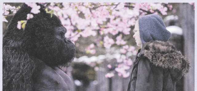
War for the Planets of the Apes (2017) Regie: Matt Reeves

So war das Tier im Kino lange Träger einer anthropozentrischen Vision der Welt, ihrer Fiktionen und ihrer Geschichte. Im digitalen Zeitalter hat die reale Welt ihre Unantastbarkeit verloren. Die Computer haben sie im Griff, ebenso wie die reale Gestalt der Tiere und der Menschen. Es ist fortan die wandelbare, den Tieren und Menschen gemeinsame digitale Haut, die uns über das Wirkliche versichert. Im neuen Planet of the Apes -Franchise verschwimmen die Grenzen zwischen den menschlichen Schauspielern und den dargestellten Affen. Die Unterscheidung zwischen Wirklichkeit und Computeranimation wird aufgehoben. So kündigt das digitale Tier eine posthumane Ära an, in der die Wirklichkeit keinerlei menschlichen Maßstäben mehr unterworfen ist. Im post-apokalyptischen, weitgehend aus synthetischen Bildern bestehenden After Earth (2013) von M. Night Shyamalan bleibt die Erde am Ende ohne Menschen, während sich in den Ozeanen die Wale austoben. Die Tiere, die bislang nur eine anthropozentrische Wirklichkeit bestätigen durften, erhalten hier eigenständige Existenz. Diese neue Autonomie zeigt auch Jean-Luc Godard in Adieu au langage (2014) anhand seines Hundes Roxy, dem Helden des Films. Das Kino öffnet für Godard ein Aussen der Welt, das für die Hunde, nicht für die Menschen da gewesen sein wird, ein Aussen jenseits der menschlichen Sprache. Das Kino wäre fortan eine Sprache der Tiere. Natürlich wird Roxy nicht