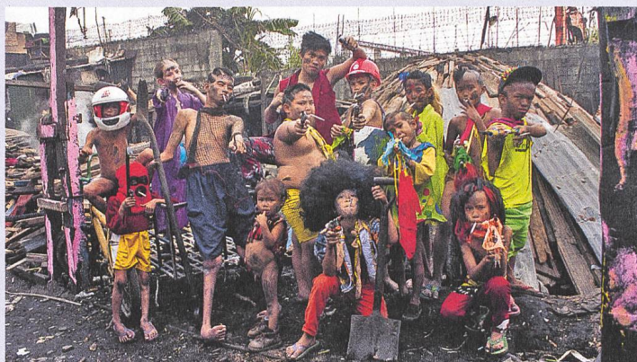
Alipato (2016) Regie: Khavn de la Cruz