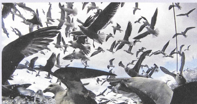
Leviathan (2012) Regie: Lucien Castaing-Taylor, Véréna Paravel

Durch seine neue Autonomie macht sich das Tier nicht nur Freunde. Der portugiesische Filmmacher Sandro Aguilar filmt in Arquivo (2007) den langen Todeskampf eines Fisches, der auf einem Tisch zappelt: Grausamer kann man die Souveränität des menschlichen Blicks auf das Tier nicht restaurieren. Lucien Castaing-Taylor und Véréna Paravel haben in ihrem auf einem Hochseefischerboot gedrehten Leviathan (2012) ihre GoPro-Kameras in die glitschigen Fischtanks geworfen, um die nicht vom Menschen gelenkte, nur vom Zufall bewegte Kamera eins werden zu lassen mit den Augen der toten Tiere, was den objekthaften und leblosen Fischen eine monströse Nachlebendigkeit verleiht.