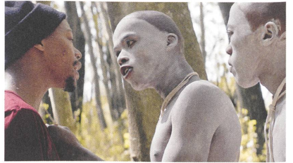
The Wound / Inxeba Nakhane Touré und Niza Jay