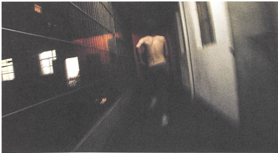
Feng ai / 'Til Madness Do Us Part (2016)