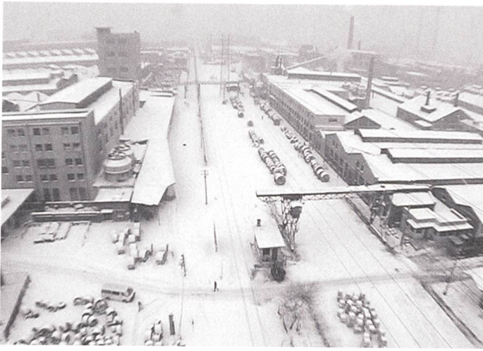
Tie xi qu / West of the Tracks (2002)