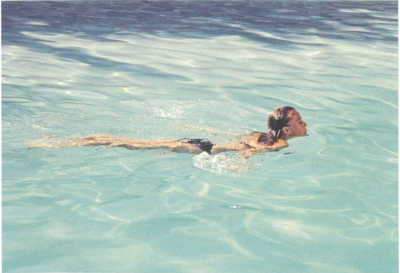
La piscine (1970) Regie: Jacques Deray, mit Romy Schneider