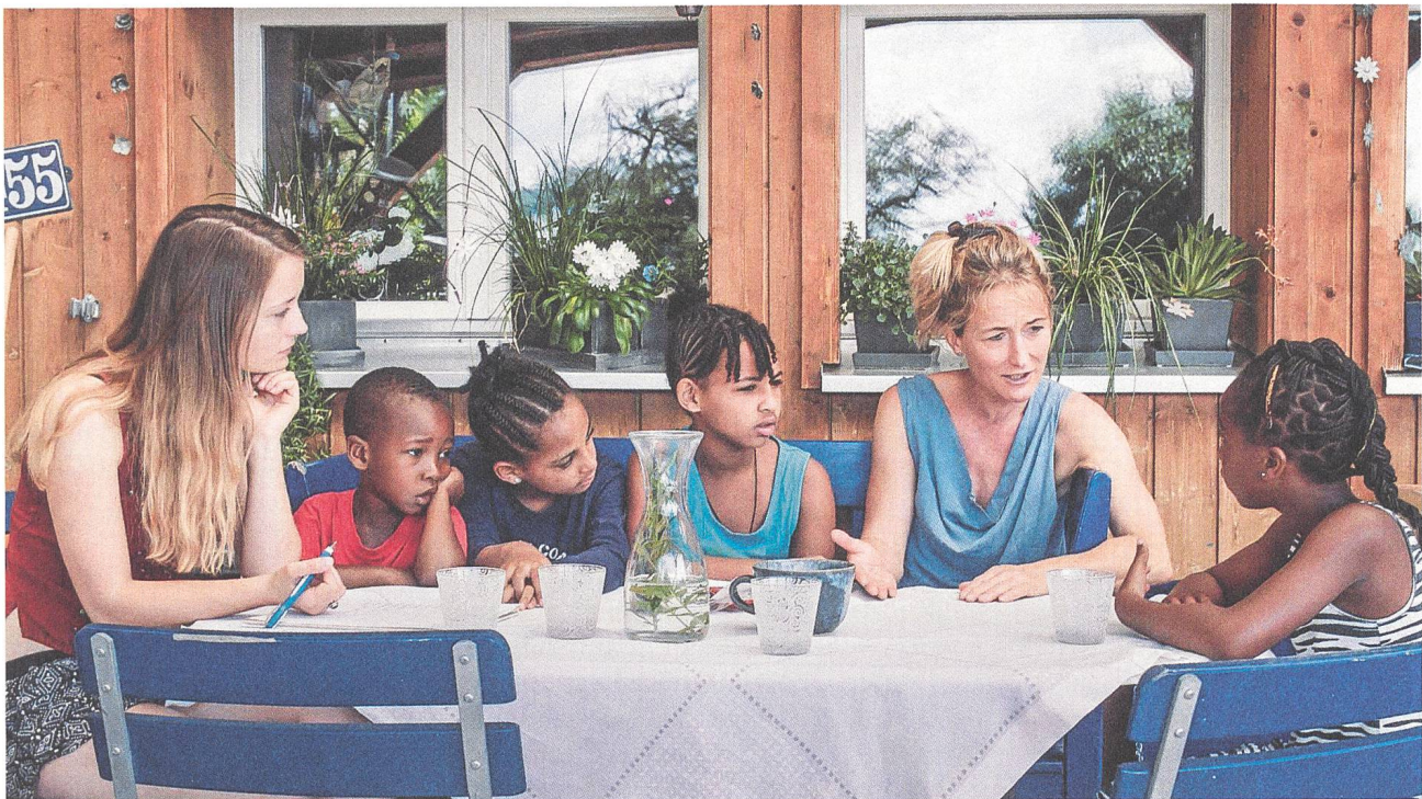
Willkommen in der Schweiz Regie: Sabine Gisiger