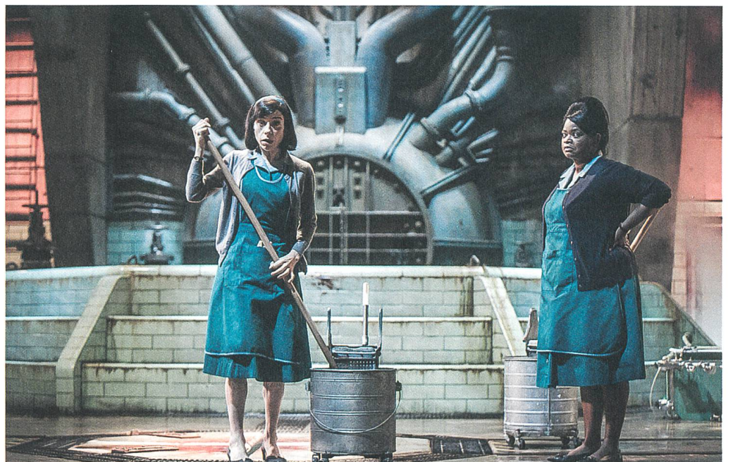
The Shape of Water Regie: Guillermo del Toro, mit Sally Hawkins und Octavia Spencer