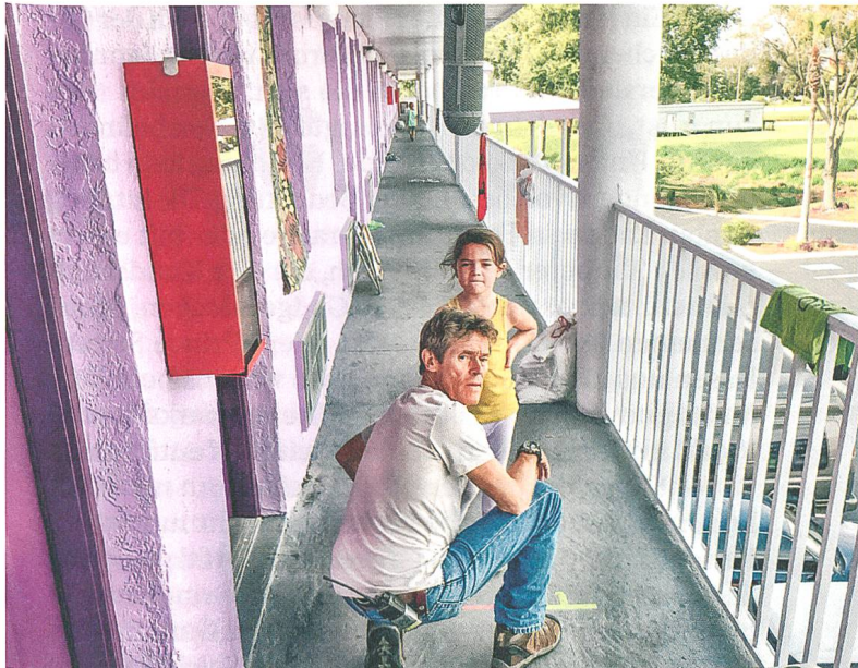
The Florida Project Willem Dafoe und Brooklynn Prince