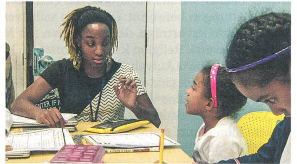
Ex Libris Regie: Frederick Wiseman