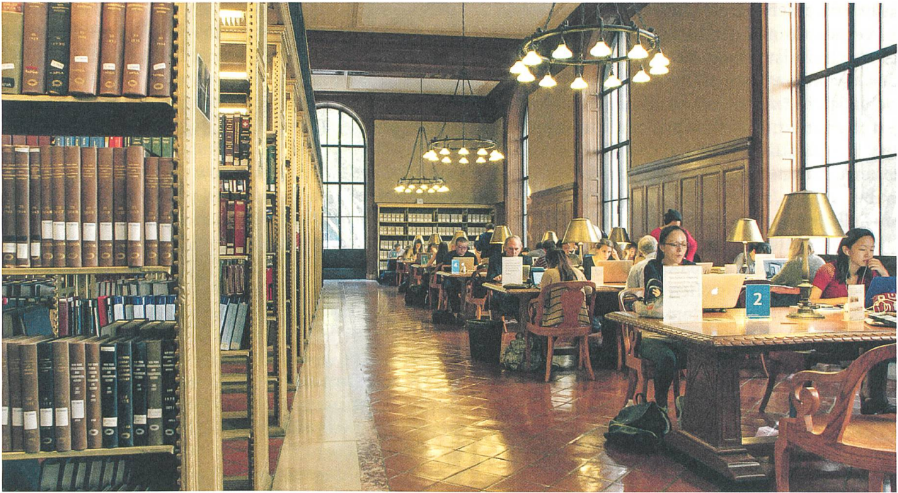
Ex Libris Regie: Frederick Wiseman