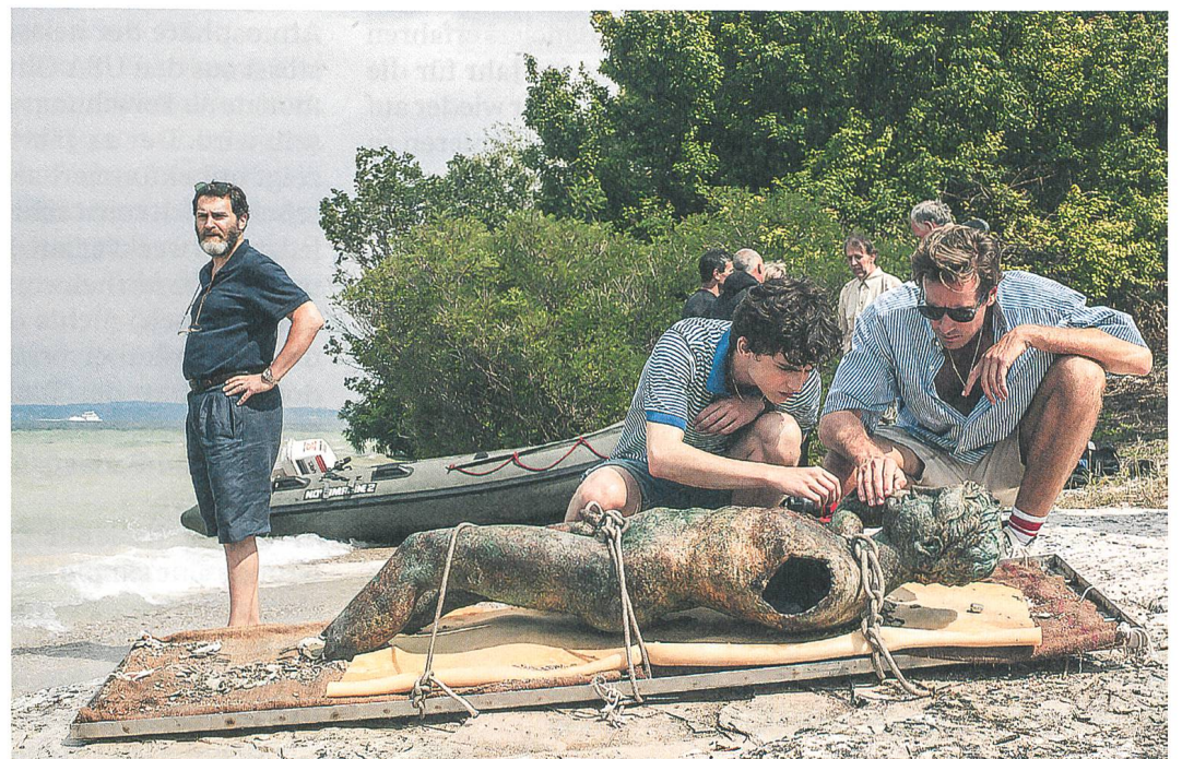
Call Me by Your Name Regie: Luca Guadagnino