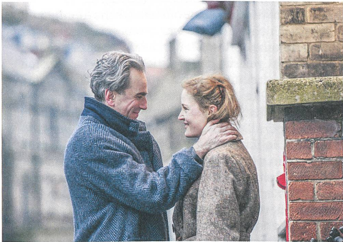
Phantom Thread mit Daniel Day-Lewis und Vicky Krieps