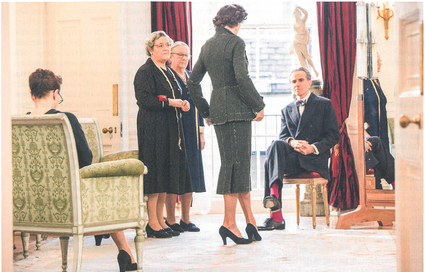
Phantom Thread Regie: Paul Thomas Anderson, mit Daniel Day-Lewis (rechts)