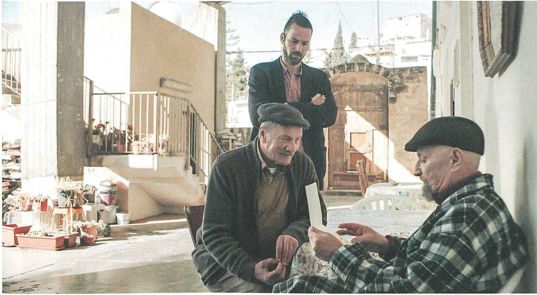
Wajib Regie: Annemarie Jacir