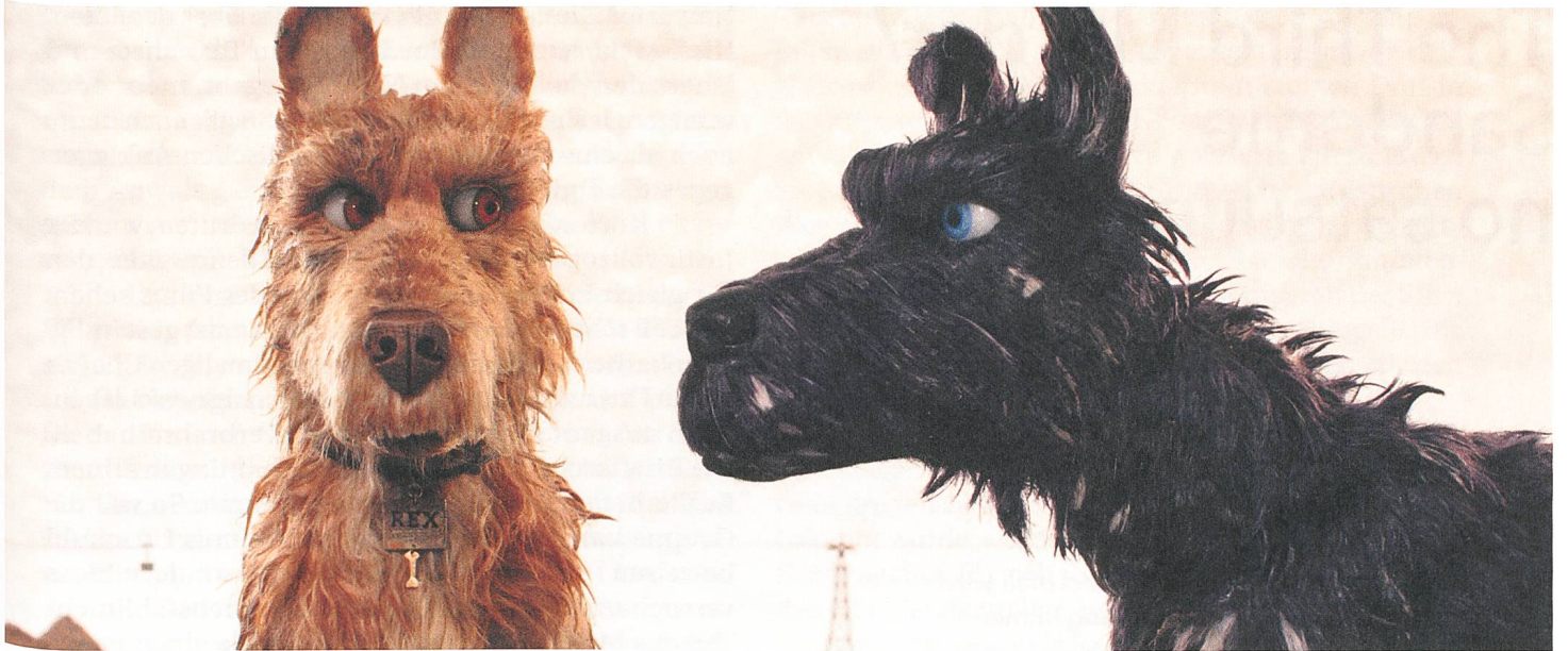
Isle of Dogs Regie: Wes Anderson