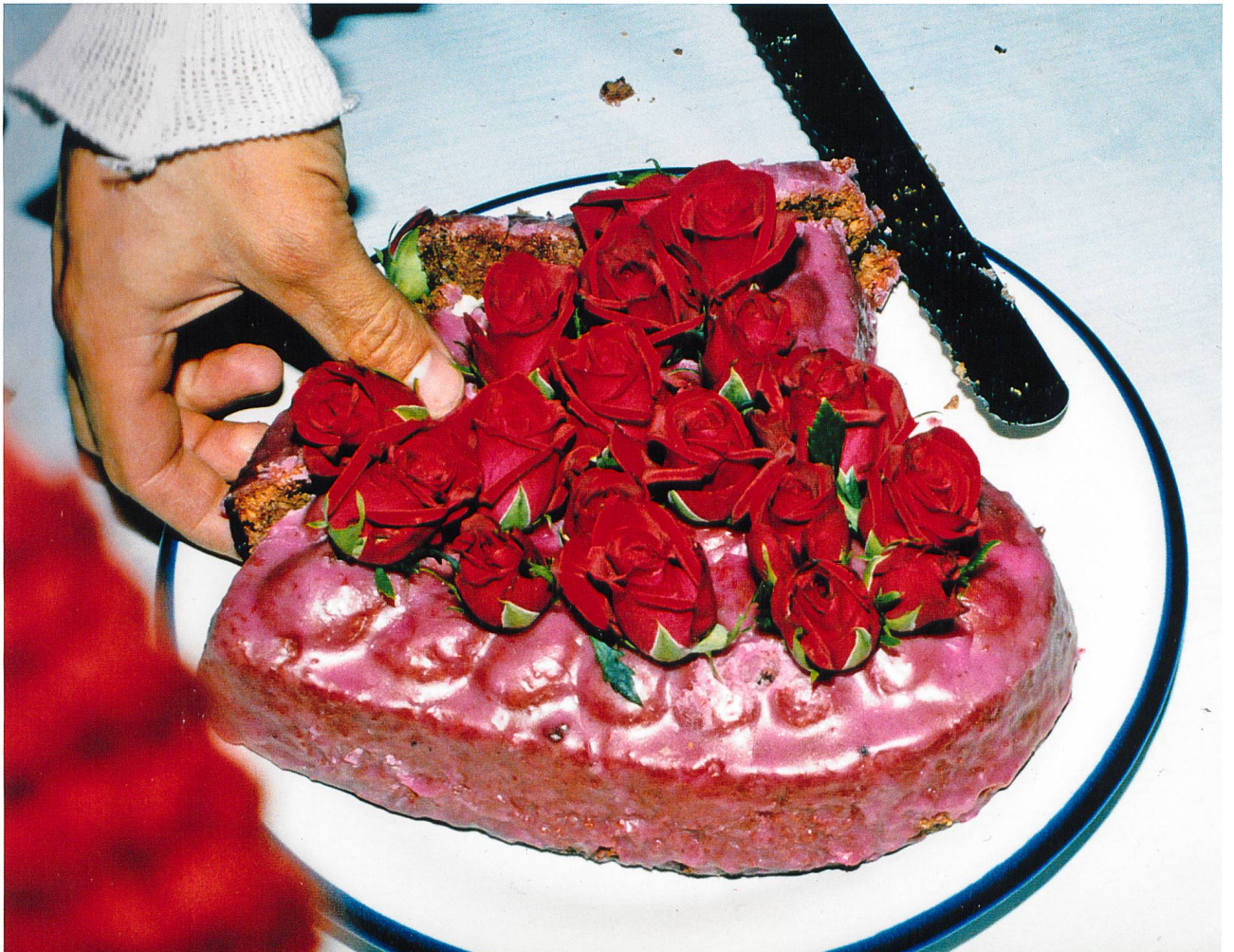
Fell in Love with a Girl Kaleo La Belle S. 16