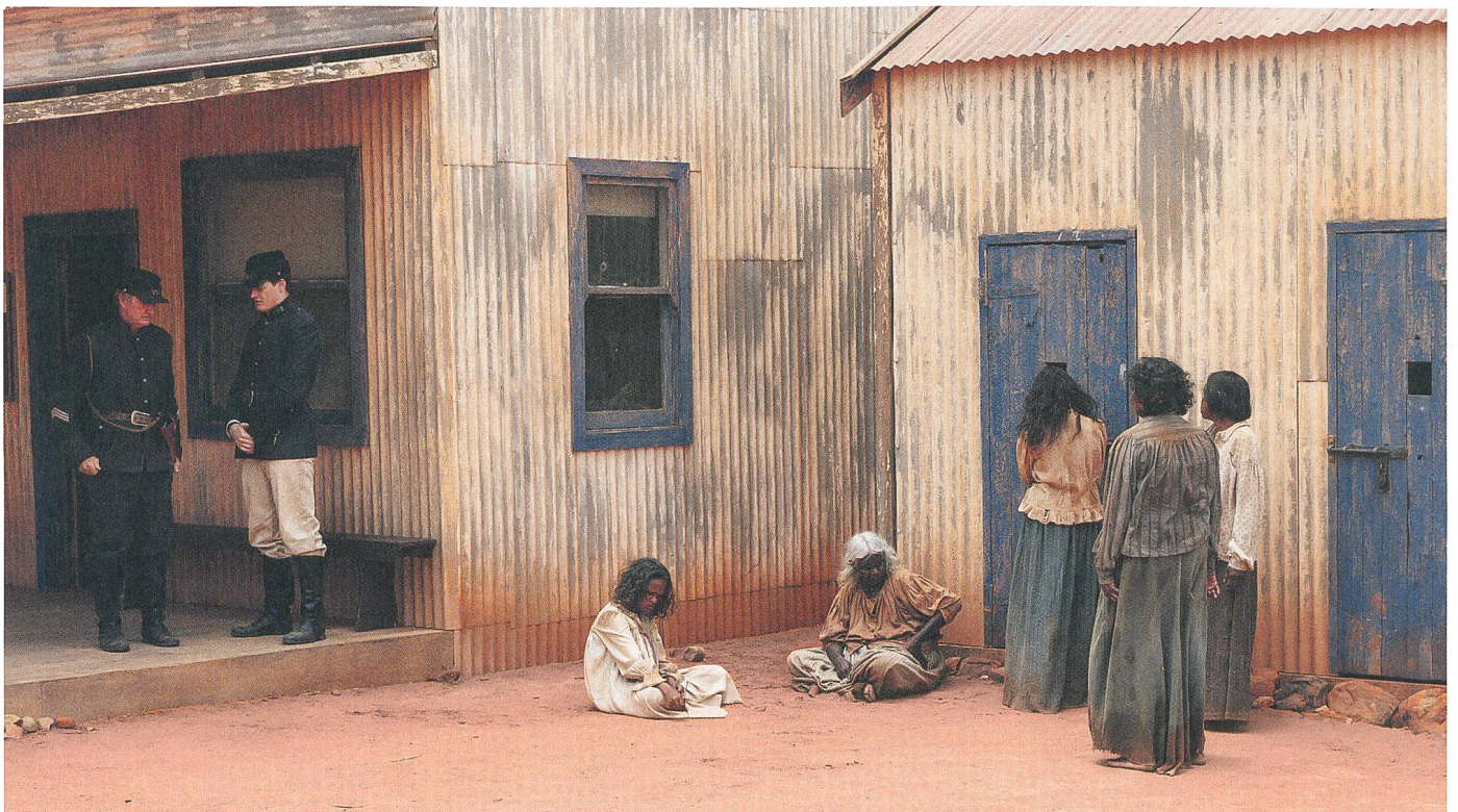
Sweet Country Regie: Warwick Thornton