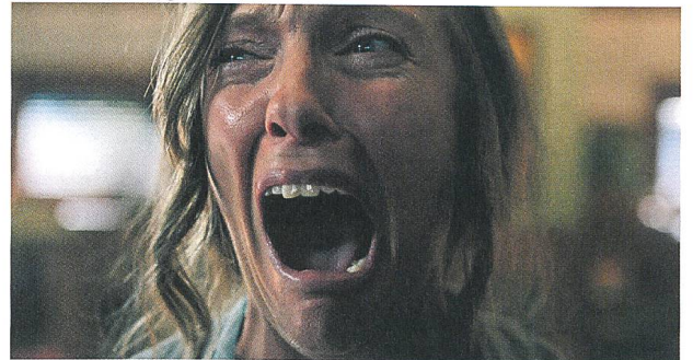
Hereditary mit Toni Collette