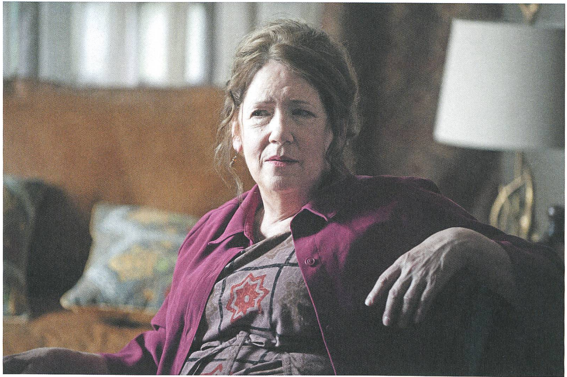
Hereditary Regie: Ari Aster, mit Ann Dowd