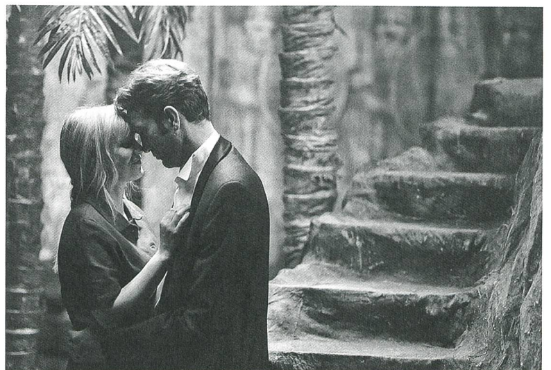
Zimna wojna / Cold War Regie: Pawel Pawlikowski