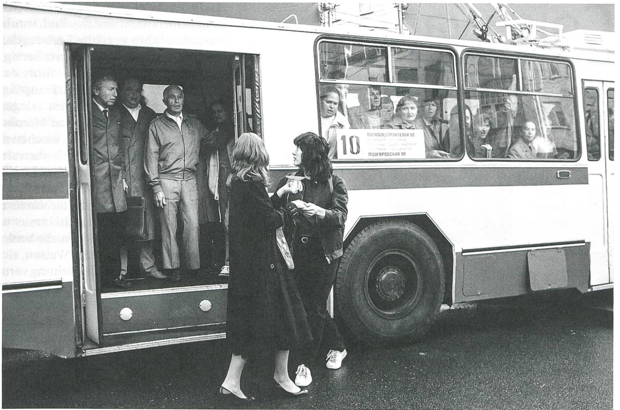
Leto Regie: Kirill Serebrennikow