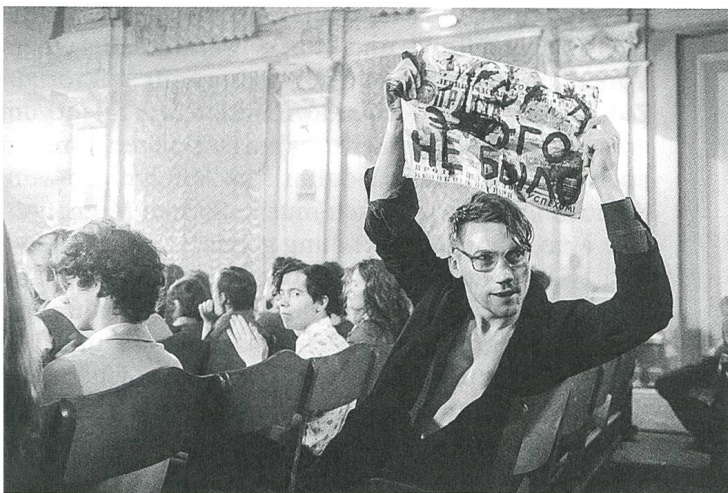
Leto Regie: Kirill Serebrennikow