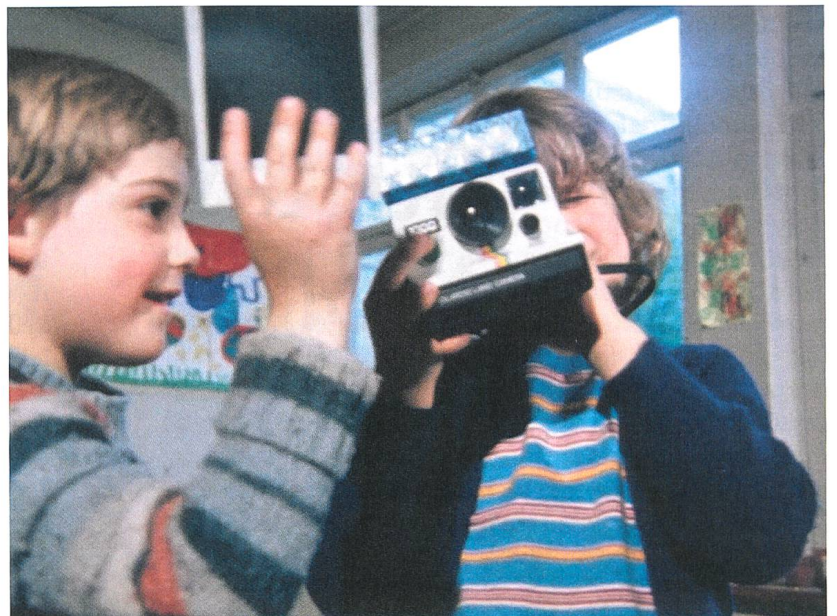
Subito. Das Sofortbild Regie: Peter Volkart