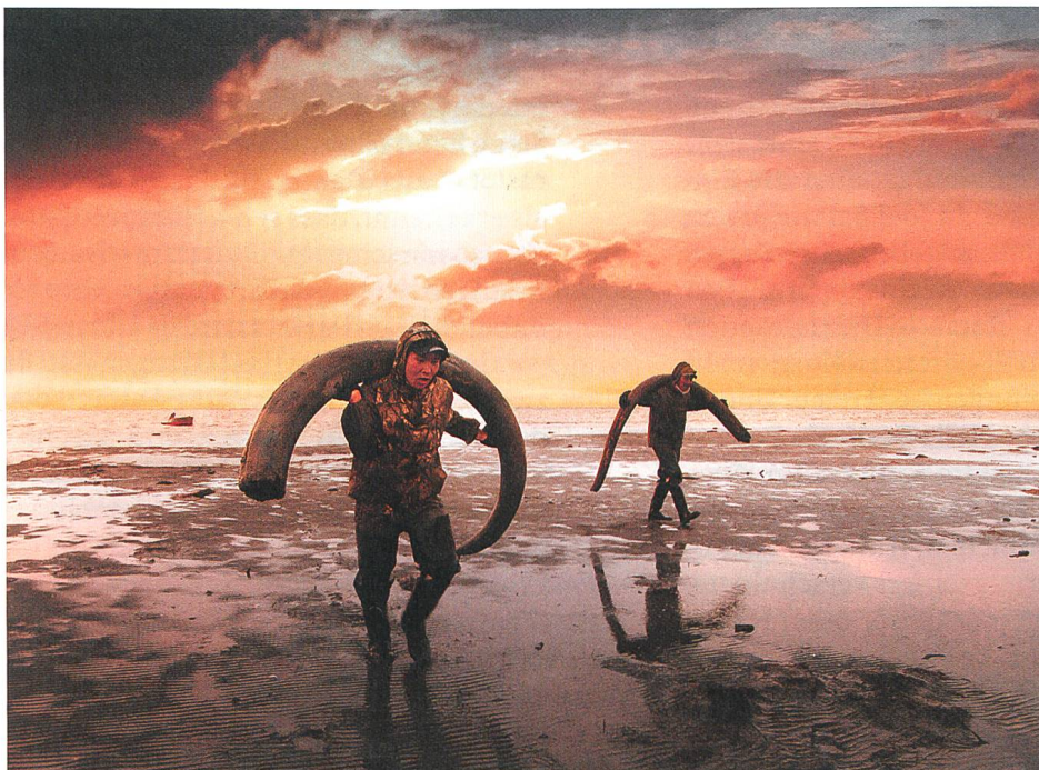
Genesis 2.0 Regie: Christian Frei, Maxim Arbugajew