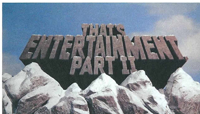
Vorspann zu That's Entertainment, Part II (1976)