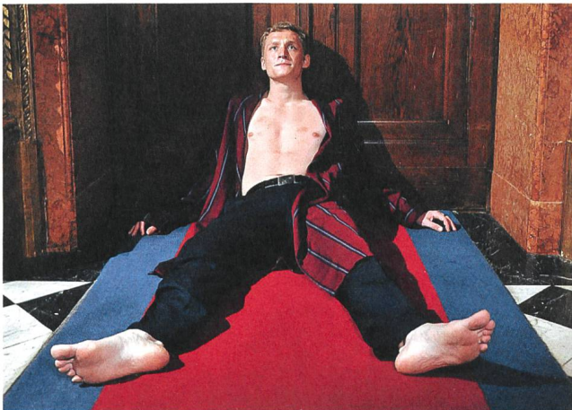
Tatort: Weil sie böse sind (2010) Regie: Florian Schwarz