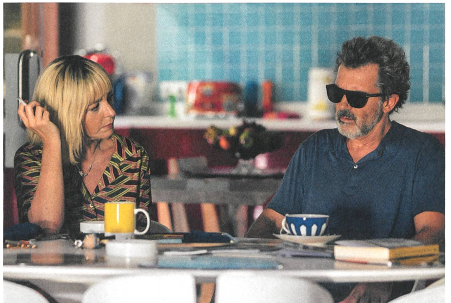
Dolor y gloria mit Cecilia Roth, Antonio Banderas