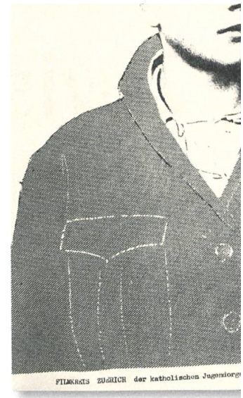
FILMbulletin ZÜRICH der katholischen Jugendorganisation