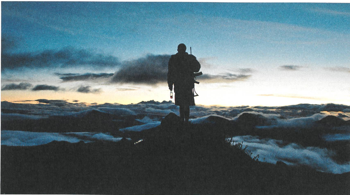
Monos Regie: Alejandro Landes